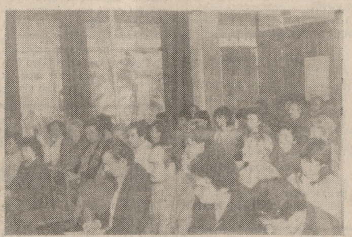
Ένα στιγμιότυπο από την χθεσινή συνέντευξη του Συλλόγου Ιδιοκτητών Φροντιστηρίων Ξένων Γλωσσών.