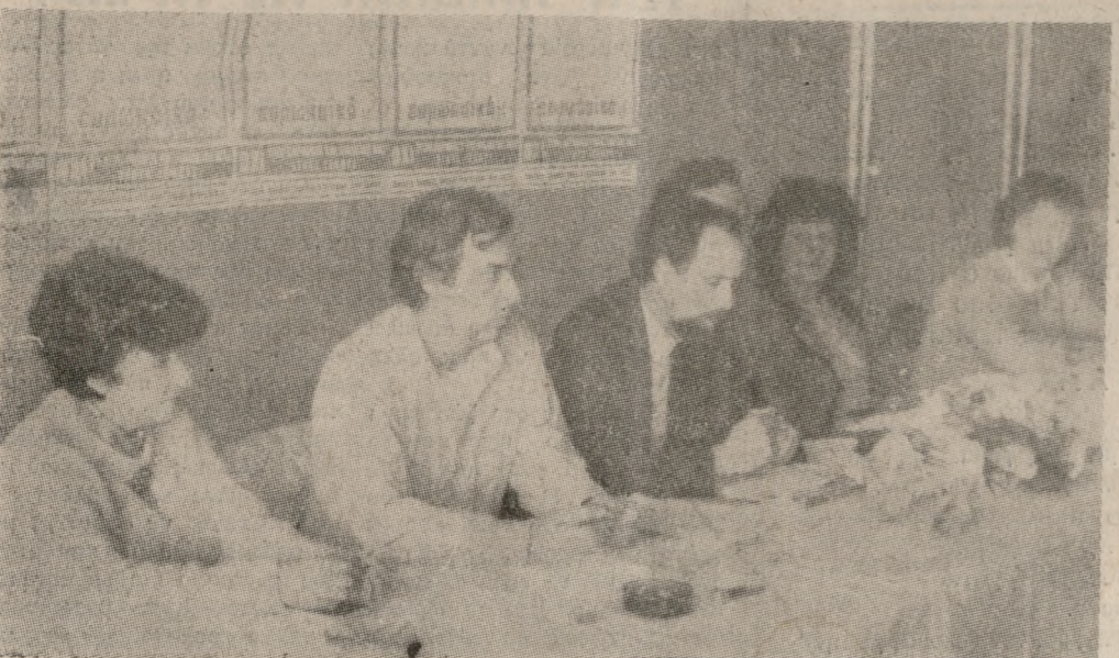
Μέλη των Προεδρείων της Ομοσπονδίας και του Συλλόγου Ανατολικής Κρήτης Ιδιοκτητών Φροντιστηρίων Ξένων Γλωσσών.