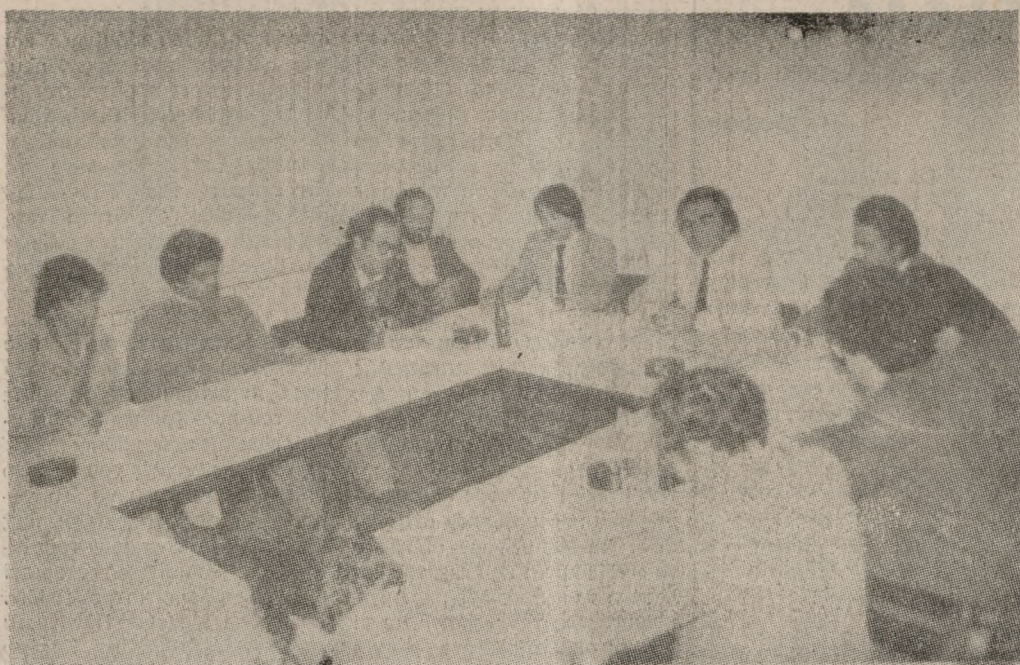
Στιγμιότυπο από τη χθεσινή συνέντευξη τύπου του Δ.Σ. του ΕΛΚΕΠΑ.