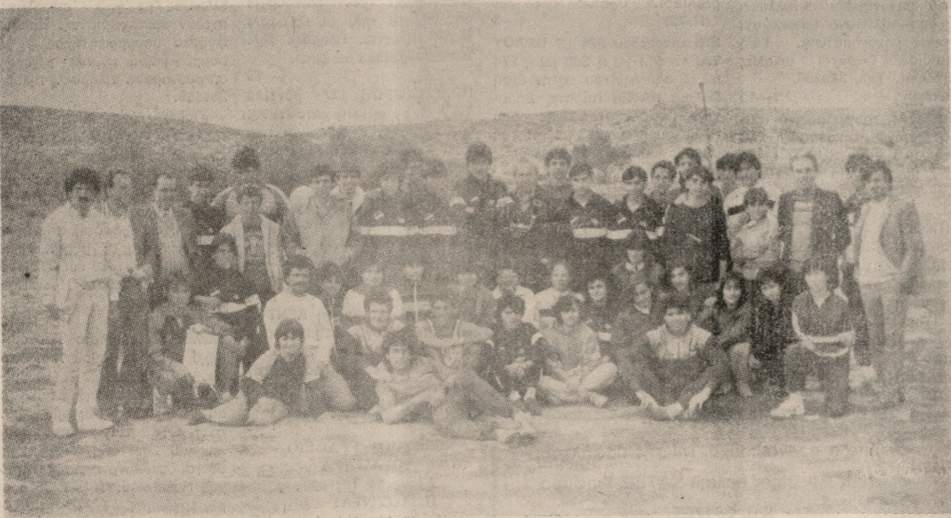
Οι αθλητές και οι αθλήτριες του Ο.Φ.Η που πήραν μέρος στο Διασυλλογικό Πρωτάθλημα Ανωνύμου Δρόμου, μαζί με τους προπονητές τους και παράγοντες του Συλλόγου, λίγο μετά την λήξη των αγώνων.