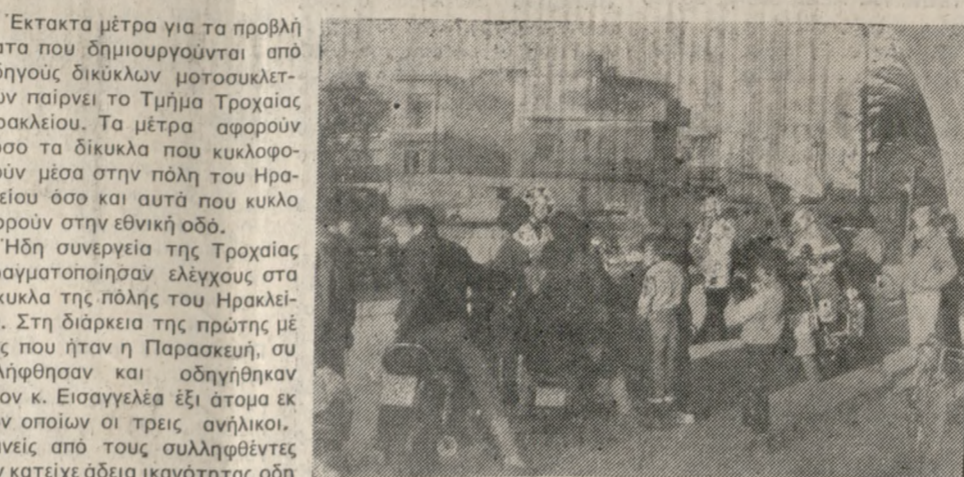
Ένα στιγμιότυπο από τους έκτακτους τροχανομικούς ελέγχους της πρώτης μέρας, μέσα στην πόλη.

Έκτακτα μέτρα για τα προβλήματα που δημιουργούνται από οδηγούς δίκυκλων μοτοσυκλετών παίρνει το Τμήμα Τροχαίας Ηρακλείου. Τα μέτρα αφορούν τόσο τα δίκυκλα που κυκλοφορούν μέσα στην πόλη του Ηρακλείου όσο και αυτά που κυκλοφορούν στην εθνική οδό.