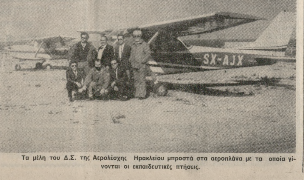
Τα μέλη του Δ.Σ. της Αερολέσχης Ηρακλείου μπροστά στα αεροπλάνα με τα οποία γίνονται οι εκπαιδευτικές πτήσεις.

ΕΚΠΩΣΕΙΣ ΣΤΑ ΕΠΙΠΛΑ ΜΠΑΜΠΟΥ ΚΑΙ ΨΑΘΙΝΑ ΕΙΔΗ 100)ο 200)ο 300)ο BAMBOO HOUSE DALVERA ΕΠΙΠΛΑ ΚΑΤΑΣΚΕΥΗΣ ΜΑΣ ΠΩΛΗΣΗ: ΧΟΝΔΡΙΚΗ - ΛΙΑΝΙΚΗ Σμύρνης 14 (Πλατ. Δασκαλογιάννης)