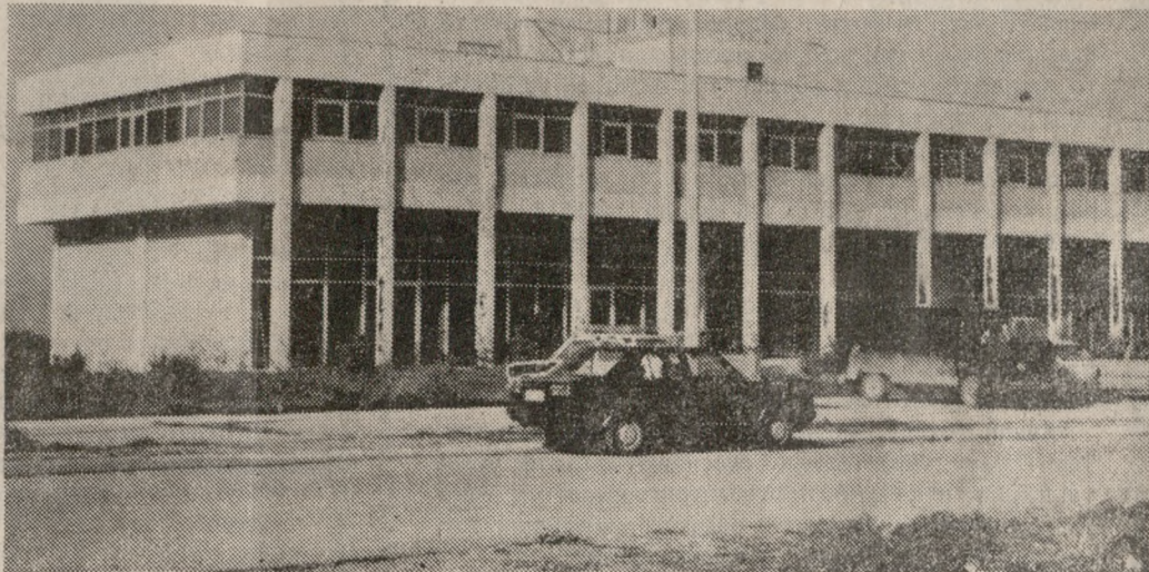
ΔΙΟΙΚΗΤΗΡΙΟ ΒΙ-ΠΕ: Ένας χώρος ανεκμετάλλετος με μεγάλες δυνατότητες αξιοποίησης.

α εκκλιση νέων οδών και του φωτισμού που προβληματίζει κά λειτουργίες, δεν μπορούμε να δεχτούμε ότι έγιναν σημαντικά έργα υποδομής. Ο Βιολογικός σταθμός και καθαρισμού είναι οπωσδήποτε ένα σημαντικό έργο για την ΒΙ.ΠΕ και τον τόπο γενικότερα. Έχει όμως το μειονέκτημα ότι δεν έχουν προβλεφθεί οι αποστάσεις ασφαλείας από τις περιβάλλουσες βιομηχανίες η δε δυνατότητα επεξεργασίας του είναι σε χαμηλά φορτία ΒΟD και COD με αποτέλεσμα βιομηχανίες με υψηλά φορτία θα πρέπει να δημιουργήσουν δικούς τους σταθμούς, ίσως και μεγαλύτερου μεγέθους του κεντρικού.