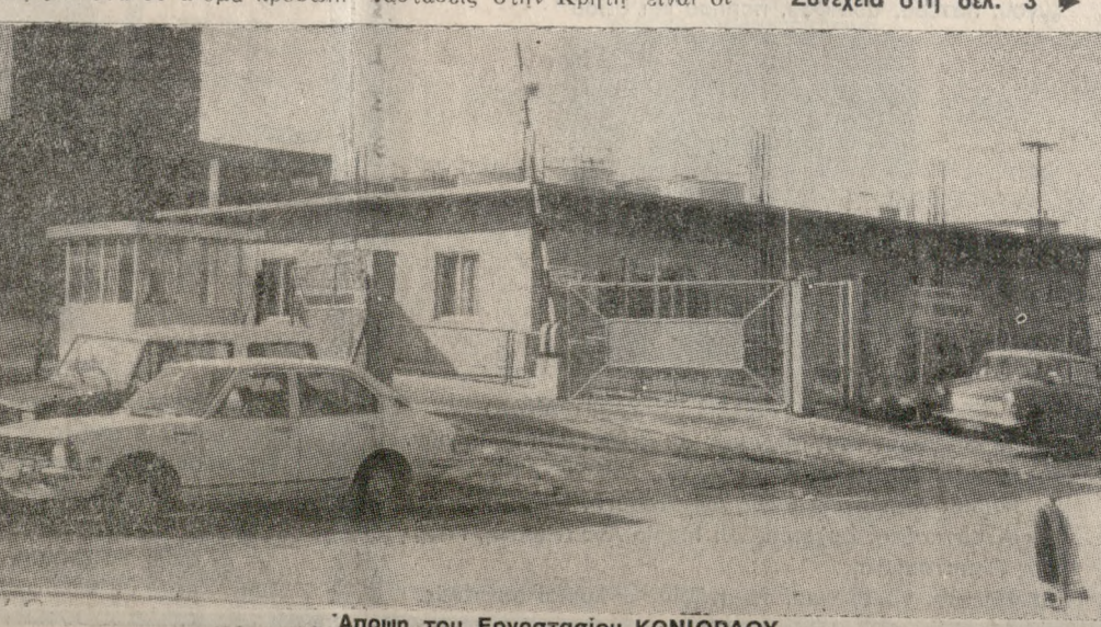
Άποψη του Εργοστασίου ΚΟΝΙΟΡΔΟΥ.