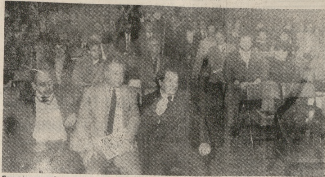
Στιγμιότυπο από τη χθεσινή πρώτη μέρα του Σεμιναρίου που οργανώνει ο Παγκρήτιος Σύλλογος Διευθυντών Ξενοδοχείων. (Φωτο: Στυύτιο ΚΟΥΛΑΤΣΟΓΛΟΥ τηλ. 226147).