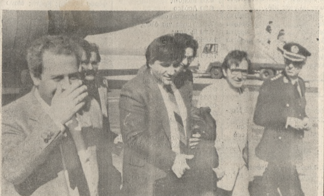
Στιγμιότυπο από την χθεσινή άφιξη στο αεροδρόμιο Ηρακλείου, του υφυπουργού Εσωτερικών και Δημόσιας Τάξης κ. Χαράλαμψου Καστανίδη.

Σύσκεψη, στην οποία συζητήθηκαν οι προτάσεις που υπέβαλε στο Υπουργείο Εσωτερικών και Δημόσιας Τάξης η Ειδική Επιτροπή για την διοικητική αναδιοργάνωση της χώρας, έγινε χθες το απόγευμα στη Νομαρχία Ηρακλείου, υπό την προεδρία του υφυπουργού Εσωτερικών και Δημόσιας Τάξης κ. Χαράλαμψου Καστανίδη. Στη σύσκεψη πήραν μέρος οι Νομάρχες Κρήτης: Χανίων κ. Παντουβάκης, Ρεθύμνης κ. Μόσχογιώτης, Ηρακλείου κ. Λουκάκης, και Λασιθίου κ. Τζανακάκης καθώς επίσης και οι Δήμαρχοι όλων της Κρήτης. Ο υφυπουργός Εσωτερικών και Δημ. Τάξης, έφθασε στις 2,15' στο αεροδρόμιο Ηρακλείου, όπου τον υποδέχθηκαν οι Νομάρχες: Ηρακλείου, Χανίων και Λασιθίου.