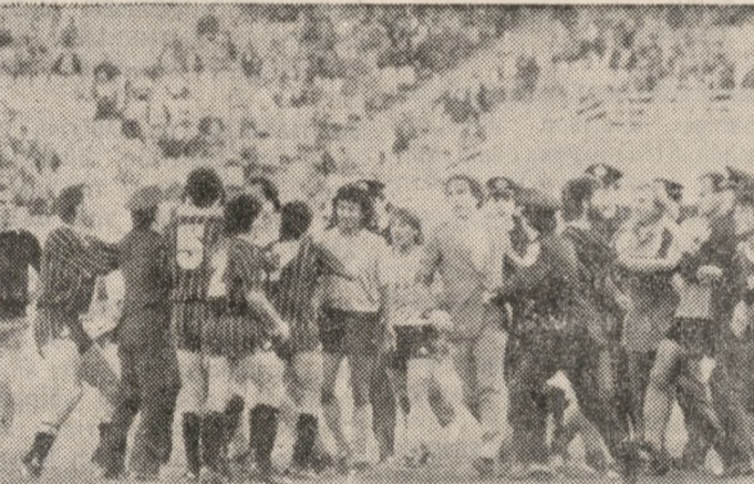
Ένα στιγμιότυπο από τα επεισόδια που έγιναν στο 58ο λεπτό του αγώνα ΑΕΚ — ΟΦΗ στο Ολυμπιακό Στάδιο.

ΑΝΘΡΩΠΟΙ που θέλουν να αποκαλούνται «φιλάθλοι» έβριζαν κατ' επανάληψη την Κρήτη, με ακατανόμαστες φράσεις.