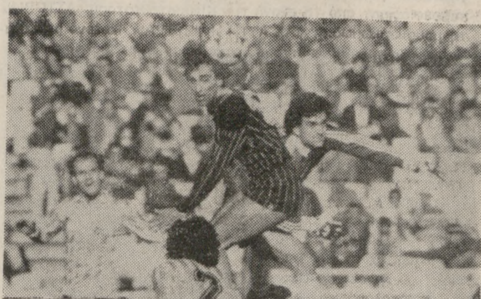
Ο Σαμαράς κερδίζει την «μάχη» αλλά η μπάλα θα φύγει άουτ.