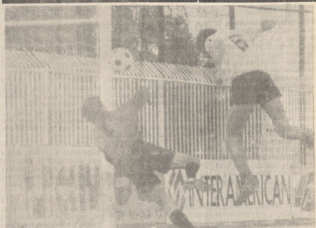
Ο Γαλαμάς με «καρφωτή» κεφαλιά παραβιάζει την εστία του Φωστήρα.

ΣΕ γενικές γραμμές το μάτς Συνέχεια στην σελ. 5