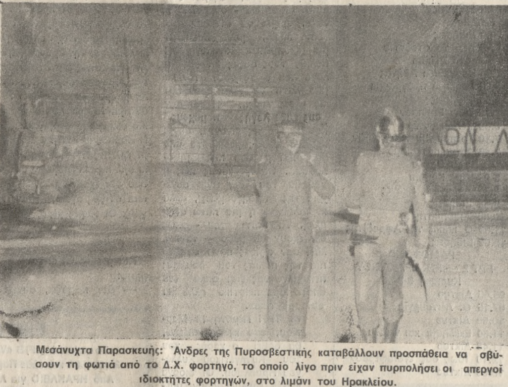
Μεσάνυχτα Παρασκευής: Άνδρες της Πυροσβεστικής καταβάλλουν προσπάθεια να σβύσουν τη φωτιά από το Δ.Χ. φορτηγό, το οποίο λίγο πριν είχαν πυρπολήσει οι απεργίο ιδιοκτήτες φορτηγών, στο λιμάνι του Ηρακλείου.

Σε επιφυλακή, δίπλα στα ακινητοποιημένα φορτηγά τους εξακολουθούν να παραμένουν οι ιδιοκτήτες των φορτηγών παρά την επιστράτευση τους και την απαγόρευση των αυτοκινήτων, τουλάχιστο μέχρι αύριο. Αυτή την απόφαση πήρε μετά την κυβερνητική παρέμβαση η συντονιστική επιτροπή αγώνα των απεργών ενώ συνεχίστηκε και χθες η επίθεση των επαγγελματιών και των φύλλων ατομικής πρόσκλησης στους απεργούς. ΠΥΡΠΟΛΗΣΑΝ ΦΟΡΤΗΓΟ ΣΤΟ ΛΙΜΑΝΙ Στο μεταξύ τις πρώτες πρωινές ώρες χθες, απεργίο ιδιοκτήτες φορτηγών, πυρπόλησαν στην είσοδο του λιμανιού φορτηγό αυτοκίνητο το οποίο και καταστράφηκε ολοσχερώς. Σύμφωνα με τα στοιχεία της Αστυνομίας, το φορτηγό ήταν παλιό χωρίς πινακίδα και αριθμό κυκλοφορίας, ανώτατο ιδιοκτήτη και το οποίο είχε αποσυρθεί από την κυκλοφορία. Για την κατάβραση της φωτιάς κλήθηκε από την Αστυνομία η Πυροσβεστική, ενώ στο χώρο του λιμανιού όπου βρίσκονται ακινητοποιημένα τα φορτηγά επικρατούσε αναταραχή ανάμεσα στους απεργούς, παρουσία και αστυνομικής δύναμης.