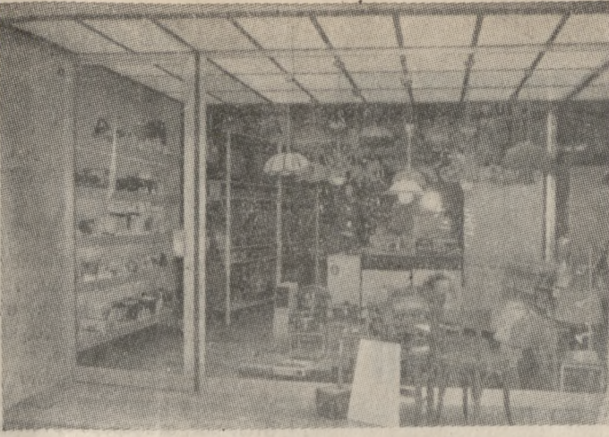
Το Κατάστημα του κ. Δημ. Μορκοδημητράκη, απ' όπου κλάπηκα τα 4 βίντεο.

ΚΑΙ ΓΙΑ να σταματήσουμε τη γκρίνια καλόν είναι να θυμηθούμε με πως οι Αποκριές θέλουμε σπίτι και οικογενειακό τζακι και τραπέζια κοινή, γονιές, συγγενών και φίλων για να εορταστούν όπως πρέπει. Με τον πατριόπαροδο, δηλαδή, ελληνικό και μάλι στα Κρητικά, τρόπο. Ο κίονος αυτός εορτασμός και η χούρος μενη οικογενειακή ατμόσφαιρα, είναι ο πρόδρομος—ωχρή αντί