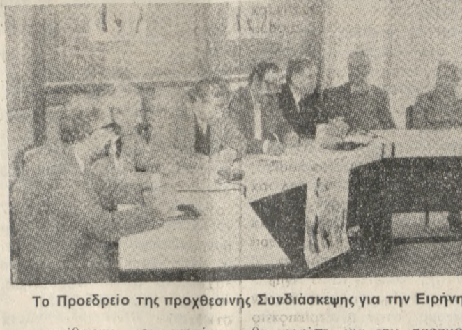
Το Προεδρείο της προχθεσινής Συνδιάσκεψης για την Ειρήνη.