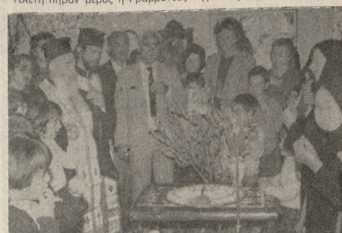
Ήμαρ Σαριδάκη, ο Πρόεδρος της Κοινότητας κ. Θεόφιλος Σουρανής καθώς επίσης και πολλοί κάτοικοι του χωριού. Στα πρόσωπα όλων ήταν ζωγραφισμένη η εθλίμη καθώς αναπολούσαν την πρόσφατη επίσκεψη στο σπίτι αυτό πριν λίγους μήνες, του Ολαφ Πάλμε. Στο κλάση της φωτογραφίας μας ένα στιγμιότυπο από την τέλεση του μνημοσύνου.

ΜΝΗΜΟΣΥΝΟ για τον δολοφονημένο Προϊστάμενο της Σουηδικής «Ολαφ Πάλμε», έγινε προχθές, την Κυριακή, στον Μοχό Πεδιάδας, στα δημοτολόγια της οποίας ο Πάλμε είχε γραφεί ως επιτιμίας Δημότης. Το μνημόσυνο τελέστηκε στο σπίτι που είχε παραχωρηθεί σ' αυτόν από τον Πρόεδρο της Κοινότητας. Στη σεμνή τελετή πήραν μέρος οι Γραμματέας της Σουηδικής Προεδρίας κ.