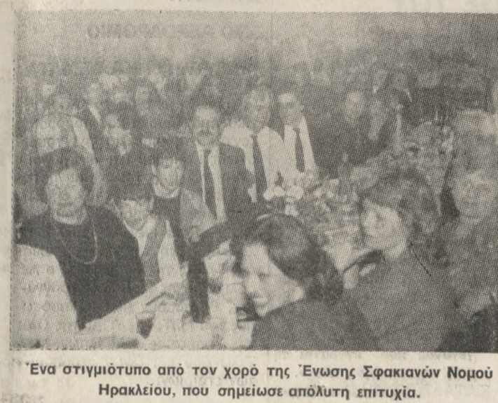
Ένα στιγμιότυπο από τον χορό της Ένωσης Σφακιανών Νομού Ηρακλείου, που σημείωσε απόλυτη επιτυχία.

«Ο επόμενος αποκριάτικος χορός μας πρέπει να οργανωθεί σε Γήπεδο. Έτσι μόνο θα αντιμετωπισθεί το πρόβλημα της χωρητικότητας». Είπε ο Πρόεδρος της Ένωσης Σφακιανών Νομού Ηρακλείου στην ολιγόλογη προσφώνησή του προς τους προσκεκλημένους, της χοροεπερείδας στο Κέντρο «ΨΗΛΟΡΕΙΤΗΣ» που είχαν κατακλύσει ασφυκτικά τη μεγάλη αίθουσα. Και είχε δίκιο, γιατί πολλοί αργοπορημένοι δεν κατάφεραν να εξασφαλίσουν τραπέζι! Η χοροεπερεία της Ένωσης Σφακιανών του περασμένου Σαββάτου 8-3-86 όπως κάθε χρόνο, αποτέλεσε και φέτος μια ξεχωριστή πολιτιστική εκδήλωση. Διακρίθηκε για την άρτια οργάνωση, το θαυμάσιο μουσικό πρόγραμμα και τα πλούσια και εκλεκτά φαγητά και δώρα (αξίας περίπου 1 εκατομ.). Το Κρητικό μουσικό πρόγραμμα του Νομού μας που διακρίνεται για τη δραστηριότητά της πρωτοστάτησε στην προσπάθεια της για την κατάρτιση μουσικού προγράμματος αντιπροσωπευτικού στις προτιμήσεις των προσκεκλημένων. Σύνταξε ένα σχετικό ερωτηματολόγιο που διανεμήθηκε και συμπληρώθηκε από όλους. Τα αποτελέσματα που θα εξαχθούν θα αποτελέσουν στο μέλλον τη βάση κατάρτισης του μουσικού προγράμματος.