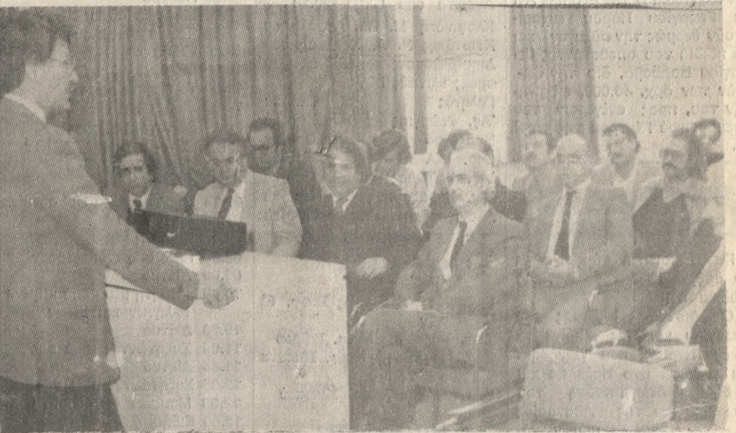
Στημιμότυπο από την χθεσινή επίσκεψη - ενημέρωση, του υπουργού Παιδείας κ. Κακλαμάνη, στο Πανεπιστήμιο Κρήτης.

ιδιαιτέρη συζήτηση έγινε για τα θέματα της σίτισης και της στέγασης που στο 'Ηρακλείο λόγω των γνωστών συνθηκών (ακριβά νοίκια κ.α.) καθώς και της πρακτικής άσκησης για την οποία υπάρχουν σπουδαστές που δεν έχουν πληρωθεί ακόμη.