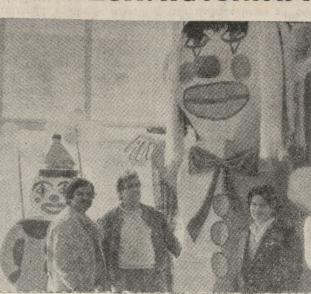
Μέλη του Συλλόγου, με τον Καρναβάλλο που θα προπορεύεται των άρμάτων.

Όμως δεν είναι μόνο αυτή η αιτία που κόνεμε το Καρναβάλι. Θέλωμε να προβάλλουμε κι ορισμένα αιτήματα τόσο της συνοικίας μας όσο και του λαού μας γενικότερα. Θέλωμε να απαιτήσουμε, χωρίς να πικράνομε ή να προκαλέσωμε κανένα, τη σύγκριση Κοινωνικοπολιτική κατάσταση. Παράλληλα ζητούμε να αναλάβει τελικά ο Δήμος την διο-