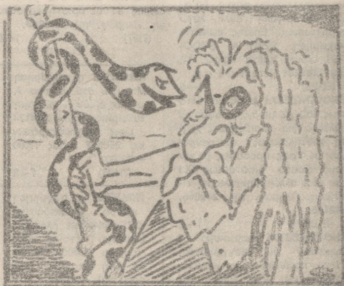
(Του ΒΑΓΓΕΛΗ ΣΑΜΑΡΑΚΗ)