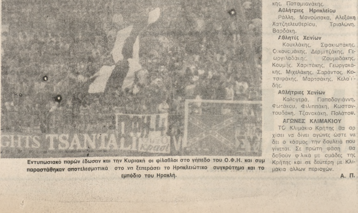
Εντυπωσιακό παρών έδωσαν και την Κυριακή οι φιλάθλοι στο γήπεδο του Ο.Φ.Η. και συμπαραστάθηκαν αποτελεσματικά στο να ξεπεράσει το Ηρακλειώτικο συγκρότημα και το γήπεδο του Ηρακλή.