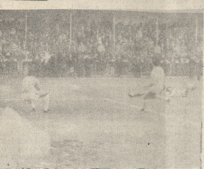
Ο Χριστόφορος σουτάρει και η μπάλα θα φύγει ελάχιστα άουτ (9ο λεπτό).