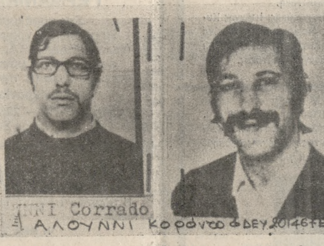
Ο Αλούνη Κοράντο, που καταζητείται για την δολοφονία του Άλντο Μόρο, σε δύο από τις μεταμορφώσεις του.