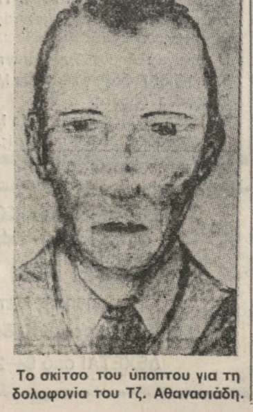
Το σκίτσο του ύποπτου για τη δολοφονία του Τζ. Αθανασιάδη.