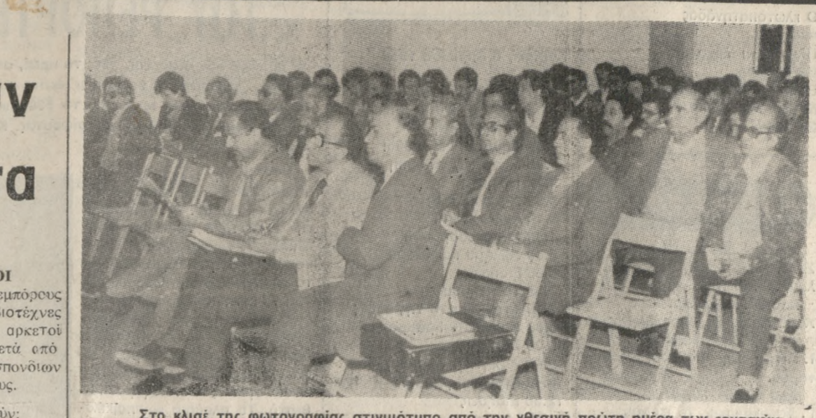
Στο κλεισ της φωτογραφίας σημιότυπο από την χθεσινή πρώτη ημέρα των εργασιών του «Επένδυση» στο ξενοδοχείο «GALAXY».

Πάνω στο Σταυρό ανακεφαλαίνονται όλο το μυστήριο της Αποκαλύψεως του Κυρίου, αλλά και επισφραγίζεται όλο το μυστήριο της θ. Απολυτρώσεως που θ. Ναζωραίου και σφραγίζεται η Διαθήκη του Θεού και η σωτηρία του ανθρώπου. Ο Σταυρός — Εσταυρωμένος είναι το αιώνιο σύμβολο της Αγάπης του Θεού προς τον άνθρωπο αλλά και ανθρώπου προς το Θεό. Με την κάθετη διάστασή του. Ο Σταυρός συμβολίζει την κατεργασμένη αγάπη του Θεού προς τον άνθρωπο και την υποσιό αγάπη του ανθρώπου, στο πρόσωπο του Νέου Αδάμ, προς το Θεό Πατέρα. Με την οριζόντια διάσταση έχου την εκτείνουσα διάσταση έχου την εκτείνουσα