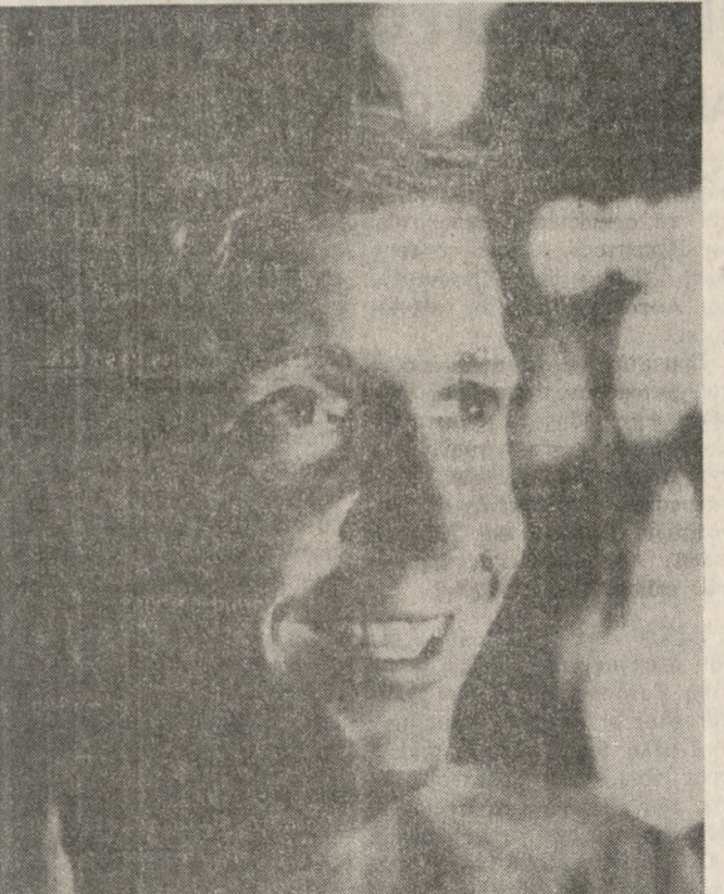
Ο διεθνούς φήμης πιανίστας Τζων Μπάτρικ (φωτογραφία) θα δώσει σήμερα στις 7,30 μ.μ. ρεσιτάλ στην αίθουσα «Εθνοτικό Πουλός». Θα παίζει Μπετόβεν, Σοπέν, Ραβέλ, Ντεμπυσσί και Ραχμάνινοβ.

καθέ ενδιαφερόμενο, να επισκεφθεί την έκθεση του και να θηυμάσει την ομορφιά της τέχνης του. Αξίζει τον κόπο.