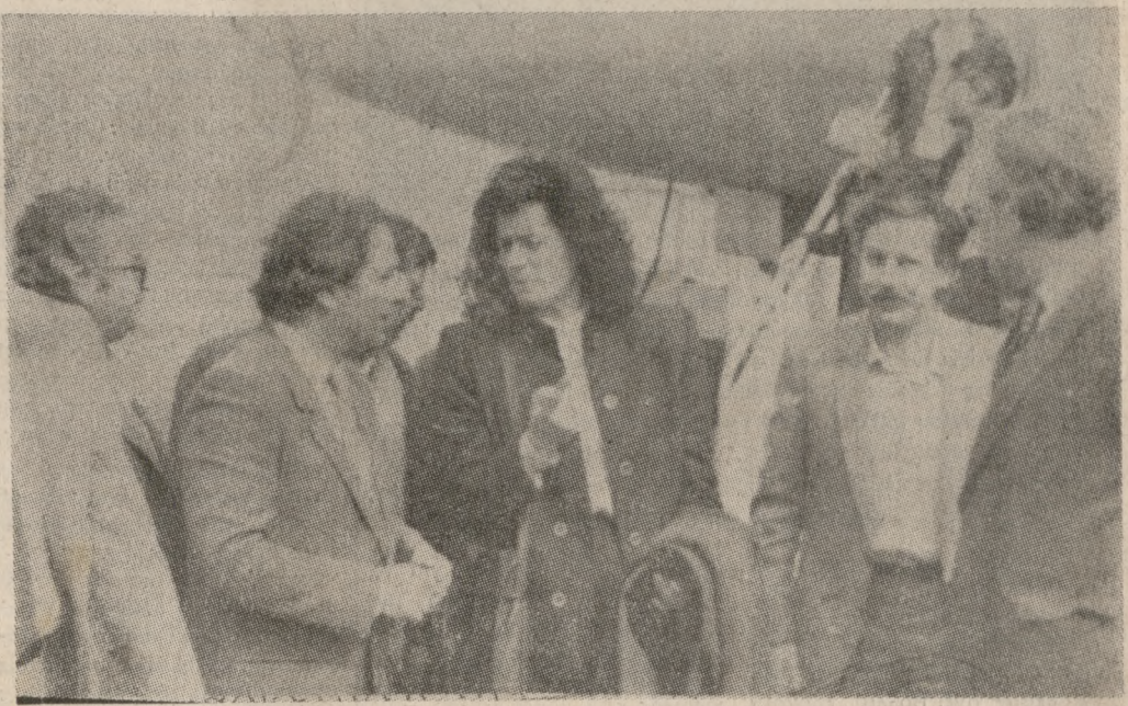
Στην τιμητική από την άφιξη της υπουργού κ. Βάσως Παπανδρέου.

παιδιά που έφθασε στις 10 το πρωί στο Αεροδρόμιο Ηρακλείου συνοδευόμενη από τον βουλευτή κ. Γεώργιο Παράκη και την υποδέχτηκαν ο Νομάρχης κ. Λουκάκης ο Αστ. Διευθυντής κ. Ψαρρούδης ο πρόεδρος της ΠΑΣΕΓΕΣ κ. Σκουλάς, ο Αερολιμενάρχης κ. Καβράκης, εκπρόσωποι του Πανεπιστημίου κ.ά. Επιστρέφοντας από τα Ανόγεια δέχτηκε στις 7 το απόγευμα στο Εμπορικό και Βιομηχανικό Επιμελητήριο εκπροσώπους των φορέων της μετοπισήσης του νομού Εμπορικό Οργανισμό Επιμελητήριο, Βιοτεχνικό, Συνέσθημα Βιομηχάνων ΒΠΠΕ, ΟΕΒΝΗ κ.ά.