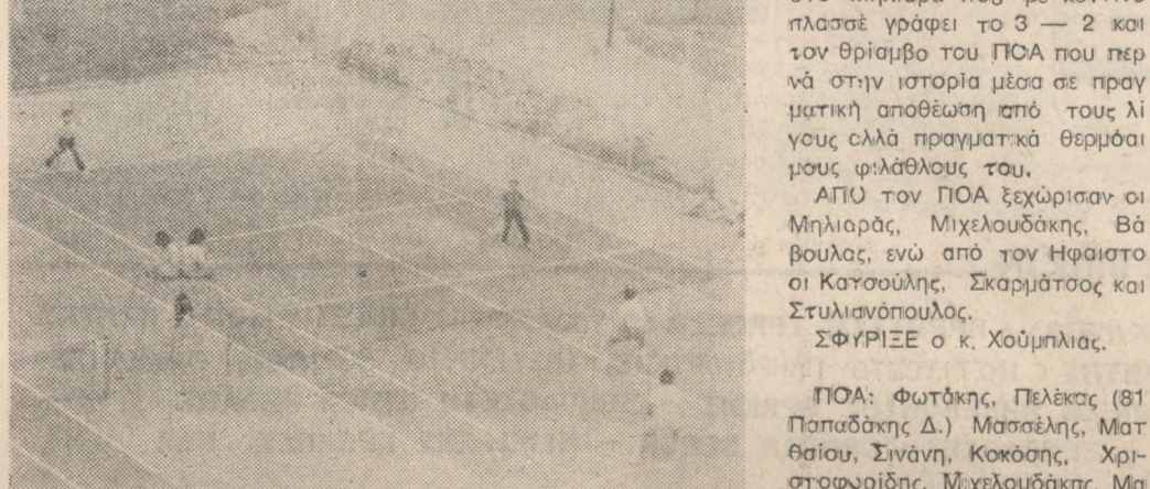
Ένα στιγμιότυπο από τους αγώνες τένις, που έγιναν από την Παρασκευή μέχρι και την Κυριακή στην πόλη μας.