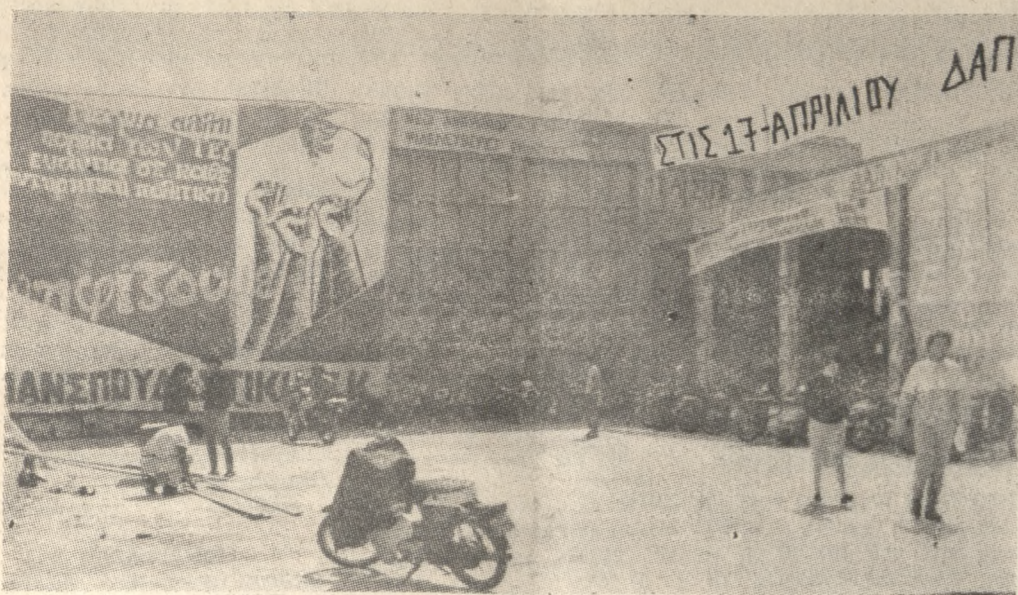
Πανώ, αφίσες, συνθήματα των παρατάξεων γεμάτοι οι τοίχοι του ΤΕΙ, ενόψει των εκλογών της Πέμπτης.