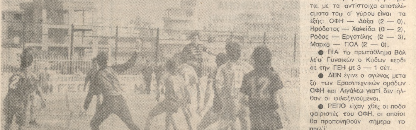
Μια φάση από τον αγώνα της Κυριακής μεταξύ Εργοτέλη και Ηλιούπολης, (0-0).