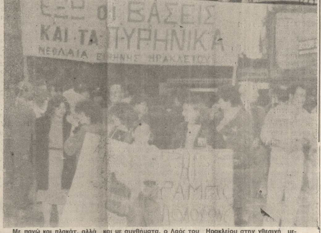
Με πανό και πλακάτ, αλλά και με συνθήματα, ο Λαός του Ηρακλείου στην χθεσινή μεγάλη συγκέντρωση καταδίκασε την επίθεση των ΗΠΑ στην Λιβύη.