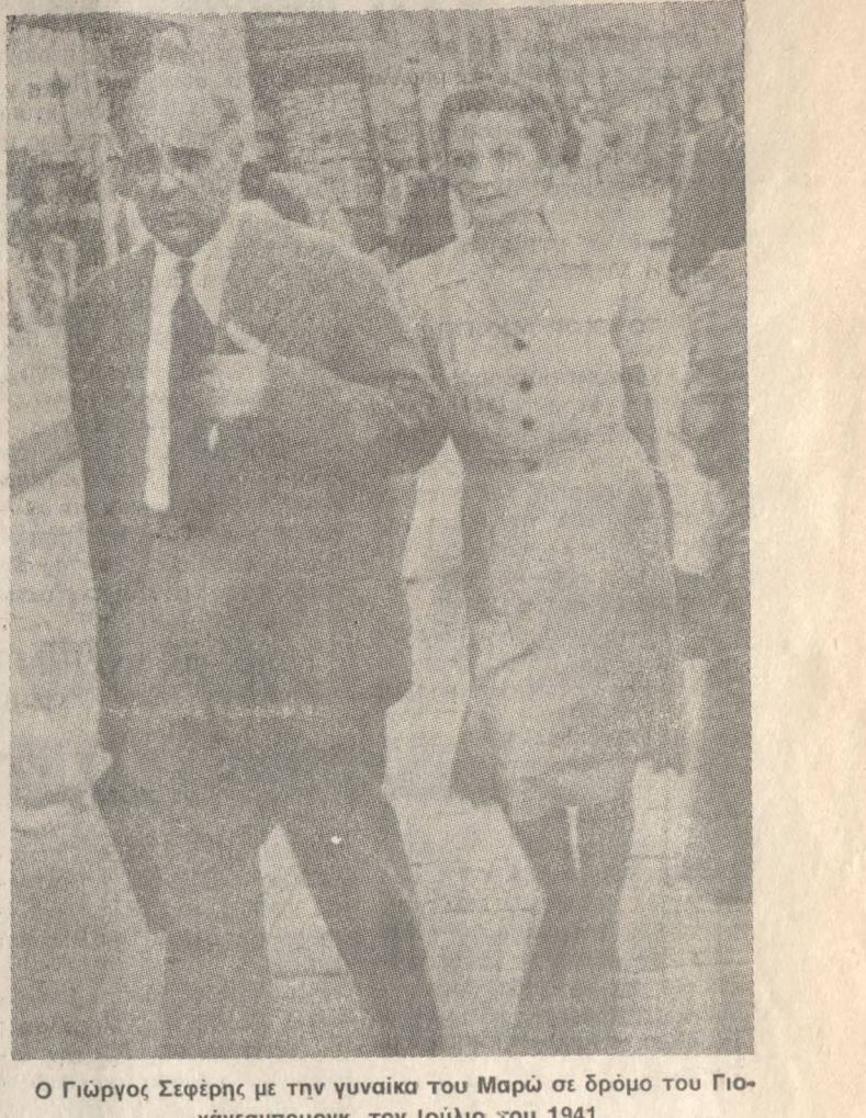
Ο Γιώργος Σεφέρης με την γυναίκα του Μαρώ σε δρόμο του Γιομυδούργου, τον Ιούλιο του 1941.

Ατμόσφαιρα φευγυό. Κρίμα να μην έχουν έρθει εδώ λίγοι άνθρωποι ζωντανόι, σαν τις τες χιλιάδες που πήγαν στο μέταπο. Τέτοια νιάτα, και να κροτούν το τιμόνι ο πιο ανήπης, οι πιο άψυχοι άνθρωποι που έβγαλε ποτέ ο τόπος. Τι κατόρα.