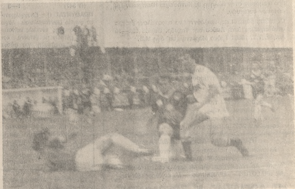
Ο Σαμαράς πλάσαρει τον Δάφκο και γράφει το 1-0.