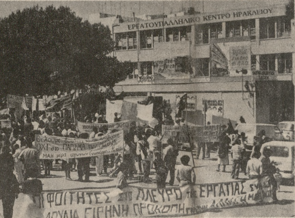
Στιγμιότυπο από τον περουνό ενωτικό γιορτασμό της Εργατικής Πρωτομαγιάς στη πόλη μας.

Σ. «Π.»: Ο χώρος του οποίου την αναγκαιότητα επισημαίνει το ΤΕΕ)ΤΑΚ, πρέπει να βρεθεί χωρίς χρονοτριβή. Και αυτό, για να εγκατασταθούν εκεί οι νέες νηξελομηχανές που θα ενισχύσουν την παραγωγή ρεύματος. Αν εγκατασταθούν στα Λινοπεράματα υπάρχει ο άμεσος κίνδυνος, όπως έχει επισημανθεί, να μεταβληθεί το Ηράκλειο σε Κερατσίνι. Η βρένη, με δεδομένους τους βρεσιδοτικούς ανέμους θα καταστρέψει την ατμόσφαιρα της πόλης και θα δημιουργήσει σοβαρότατο πρόβλημα για τον τόπο. Ανάγεται λοιπόν να βρεθεί εκδώ και τώρα» ο νέος χώρος εγκατάστασης του νέου ΑΗΣ. Για να γίνει όμως αυτό, η προσπάθεια των Τεχνικών Επιμελητηρίων της Κρήτης θα πρέπει να ενισχυθεί και από τον Δήμο Ηρακλείου, και α-