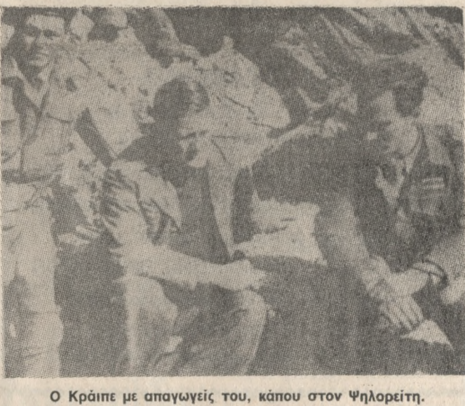
Ο Κράιπε με απαγωγείς του, κάπου στον Ψηλορείτη.

Ως γνωστό, ο κ. Θαν. Σκουλάς υπήρξε και προ των εκλογών του Ιουνίου του 1985 Γεν. Γραμματέας του Υπ. Κοινωνικών Ασφαλίσεων από όπου παραιτήθηκε για να πολιτευθεί.