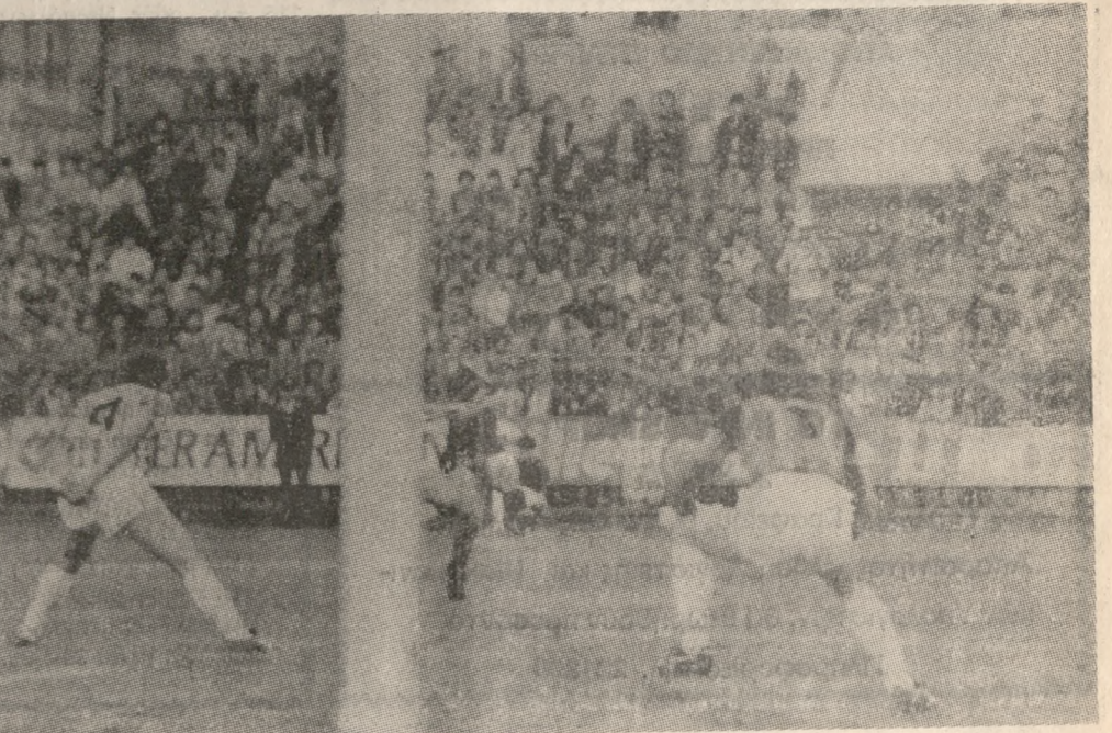
Μία φάση από τον αγώνα Ο.Φ.Η. — Ολυμπιακού του α' γύρου, που είχε λήξει με νίκη (0-1) των ερυθρολευκών.