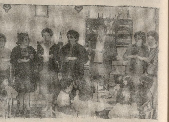
σε την Πέμπτη το γεύμα, που αποτελείται από φακή, και χθες τα μικρά παιδιά του Νηπιαγωγείου πήγαν ομαδικά στην εκκλησία και ακινώνησαν των Αχράντων Μυστηρίων.