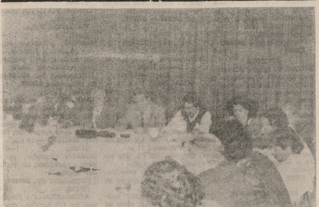
Ένα στιγμιότυπο από την συνέντευξη Τύπου που δόθηκε την Τετάρτη στο «Ξενοία» για τα «Β' Βαρδινογιάννια».

ΣΤΟΧΟΣ ΤΟΥ ΔΙΟΡΓΑΝΩΤΗ ΣΥΛΛΟΓΟΥ Νά γίνουν μεσογειακοί αγώνες τὰ «Βαρδινογιάννια»