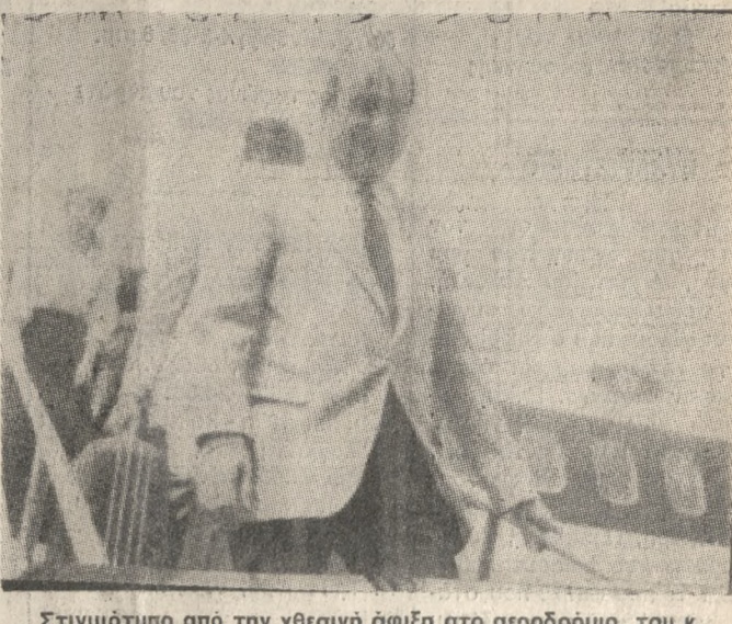
Στιγμιότυπο από την χθεσινή άφιξη στο αεροδρόμιο, του κ. Κων/νου Μητσοτάκη.