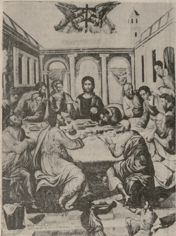
«Του Δείπνου Σου του Μυστικού...»