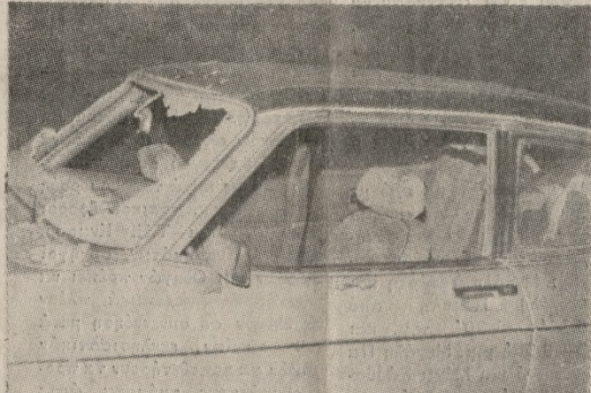
Το «FORD Κάπρι» του δολοφονημένου Προέδρου Γιάννη Κουτσάκη με σπασμένο από τις σφαίρες παμπρίζ, λίγα λεπτά μετά την προχθεσινή επίθεση του άγνωστου δολοφόνου.

Στόχος της ανακριτικής έρευνας, όπως δήλωσε σχετικά στην «Π» χθες αρμόδια πηγή, είναι η ανάκριση να στραφεί προς όλες τις κατευθύνσεις. Σύμφωνα, ωστόσο, με τα μέχρι στιγμής στοιχεία και παρά την στεγανότητα που υπάρχει στο ανακριτικό έργο τα δεδομένα που υπάρχουν είναι: ● Ο δράστης (ή οι δράστες) θα πρέπει να είχε σαν στόχο τον μόνο το θύμα. ● Ο δράστης θα πρέπει να έχει ικανότητες στη σκοποβολή, δεδομένου ότι ο στόχος του (το αυτοκίνητο του προέδρου) βρισκόταν σε κίνηση. ● Η επιλογή της θέσης από την οποία ο δράστης πυροβόλησε το θύμα του ήταν «αριστοτεχνική» επιλεγμένη, δεδομένου ότι τον εξασφάλισε (του δράστη) ορατότητα και ακόμη πριν τον αυτοκίνητο βρεθεί στην ευθεία του όπλου του, αλλά αντίθετα του πρόσφερε κάλυψη από το μέρος του δρόμου τόσο λόγω της συστάδας των θάμων που βρισκόταν στην κορυφή της πλαγιάς, όσο και λόγω του απότομου ύψους (περίπου 25 μέτρων από το δρόμο) που βρισκόταν η κρυψώνα του δράστη. ● Το όπλο που χρησιμοποίησε