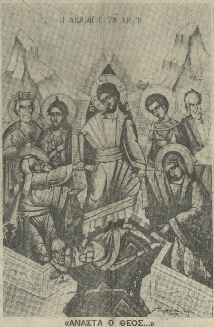
«ΑΝΑΣΤΑ Ο ΘΕΟΣ...» Η «ΠΑΤΡΙΣ» ΕΥΧΕΤΑΙ στους συνδρομητές και αναγνώστες της ΕΥΤΥΧΙΣΜΕΝΟ ΚΑΙ ΧΑΡΟΥΜΕΝΟ ΤΟ ΠΑΣΧΑ