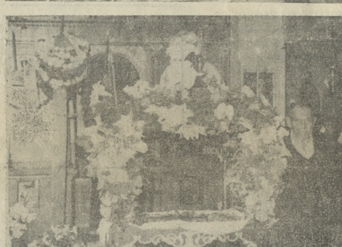
Καλαίσθητα διακοσμημένοι οι Επιτάφιοι των Ιερών Ναών Μιχαήλ Αρχαγγέλου, Αγίου Στυλιανού (Δελινού), Κοιμήσεως της Θεοτόκου (Μασταμπά), της του Θεού Σοφίας, Αγίου Ιωάννου, Αγίου Γεωργίου (Πόρου), Αγίου Νικολάου (Αλικαρνασού), Ευαγγελισμού (Γουρνών) και Αγίου Αναργύρων (Κοκκίνη Χάνι).