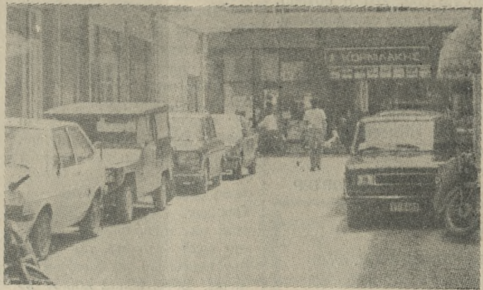
Οι στενοί δρόμοι και το αναγκαστικό, απ' την έλλειψη ειδικών χώρων παρκάρισμα σ' αυτούς, συντελούν στην οξύνση του κυκλοφοριακού προβλήματος.

Ζούμε ακόμη, και θα ζούμε, ίσως για πολύ, κάτω από την υπαρκτή απειλή ενός πυρηνικού νέφους. Το πώς, και γιατί προκλήθηκε, δε μετράει, ούτε θα μετρηθεί για την ιστορία. «Ο,τι μετράει, είναι οι κίνδυνοι και τα μέλλον