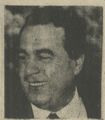
Ο υφυπουργός Γεωργίας κ. Δημ. Πιτσιώρης θα κηρύξει σήμερα το πρώτο ημερήσιο εργαστήριο του σεμιναρίου.

Το σεμινάριο, που απευθύνεται στους παραγωγούς και στοχεύει στην άμεση πληροφόρηση για τα σύγχρονα επιστημονικά συμπεράσματα που φερόσυν τόσο την καλλιέργεια της σουλτανίνας (αναμείγωση - καλλιέργεια τεχνική), όσο και την επεξεργασία του προϊόντος (αποθήκευση - αποθήκευση - βιομηχανική επεξεργασία), διοργανώνεται από την Κ.Σ.Ο.Σ. με την συνεργασία του υπουργείου Γεωργίας και του Εργαστηρίου Αμπελολογίας της Ανώτατης Γεωπονικής Σχολής Αθηνών.