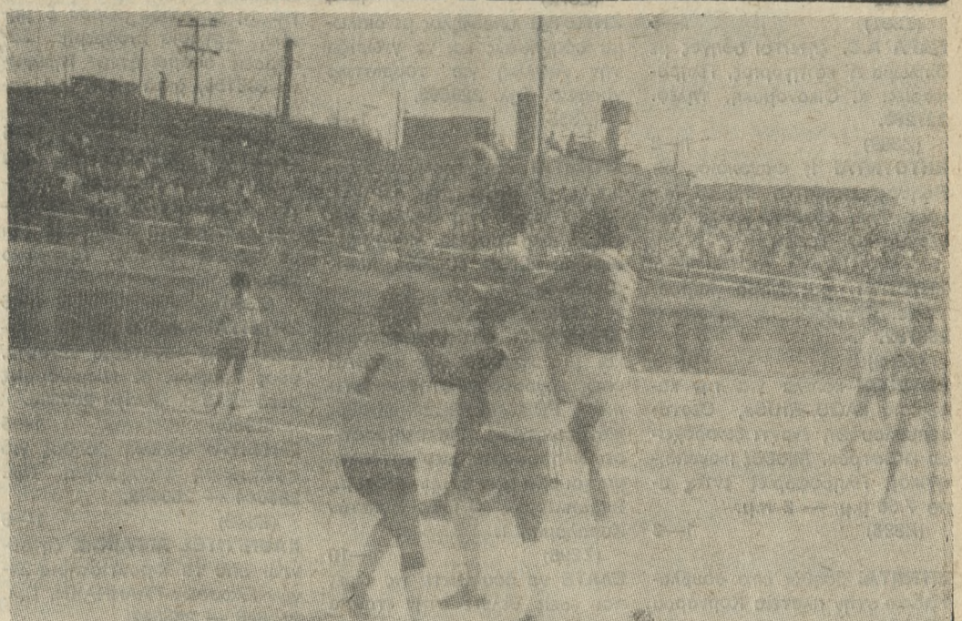
Ένα στιγμιότυπο από τον αγώνα ΠΟΑ — ΑΟΑΝ (4-1).