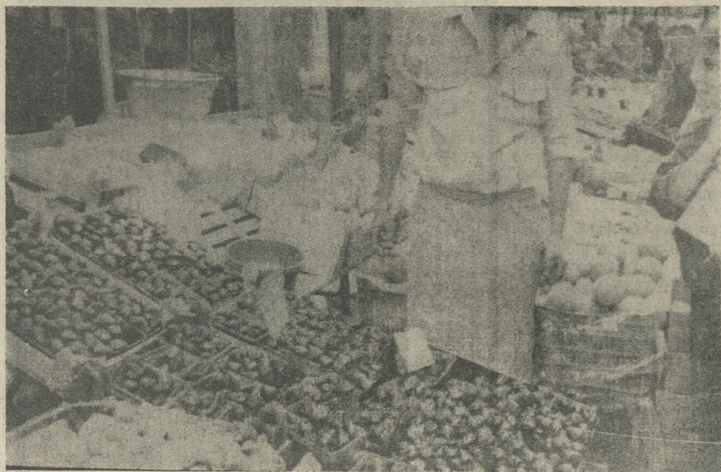
Κανένα πρόβλημα στα λαχανικά θερμοκηπίων με τα οποία σήμερα τροφοδοτείται η αγορά της πόλης.