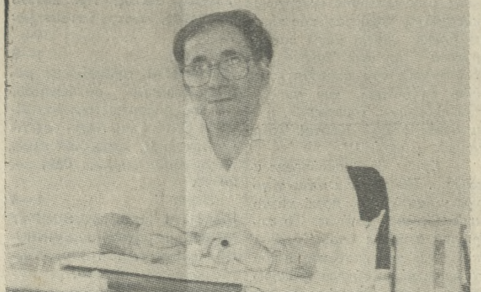
Ο πρώτος Πρόεδρος του Πανεπιστημίου Κρήτης κ. Δημήτρης Μαρκής.

«Π»: Κύριε Μαρκή, είστε ο πρώτος αρχηγός της Πρωτανείας, ο «άνδρας των αρχών» δηλαδή του Πανεπιστημίου της Κρήτης. Το πρόγραμμά σας για την μελλοντική πορεία του Π.Κ. όπως το εκθέσατε και στη Διακήρυξη Αρχών της Πρωτανικής τριάδας, είναι βεβαίως γνωστό στην Πανεπιστημιακή κοινότητα, όμως στον ευρύτερο κόσμο που ενδιαφέρεται για την πορεία του Π.Κ. αφού αποτελεί αναπόσπαστο κομμάτι της κοινωνικής ζωής είναι ελάχιστα γνωστό. Θα μπορούσατε σε βραχείες γραμμές να μας πείτε τις θέσεις σας;