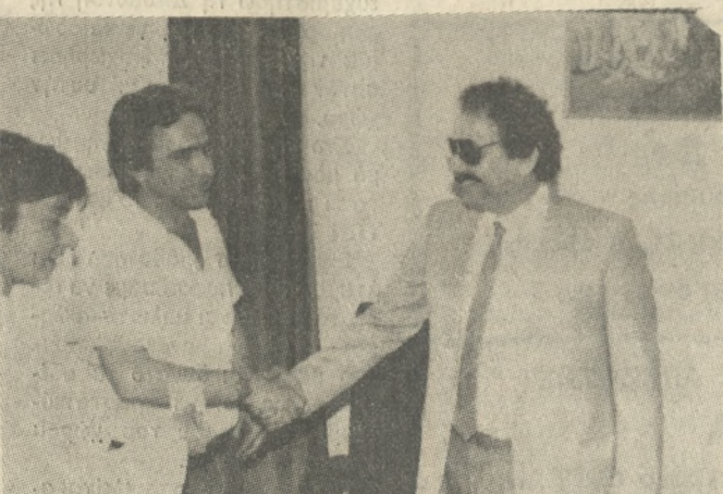
Ο κ. PEREZ ενώ ανταλλάσσει χειραψία με τó σύμβουλο του Νομάρχη κ. Νίκο Μπουρατζάκη.

«Είμαστε ένας ειρηνικός λαός και κάνουμε την επανάσταση για το καλό μας. Γι' αυτό το λόγο είμαστε αποφασισμένοι να την υπερασπίσουμε με κάθε μέσο». Αυτή την κατηγορηματική δήλωση έκανε χθες το μεσημέρι στους δημοσιογράφους στη διάρκεια συνέντευξης Τύπου που έδωσε στο Νομαρχιακό Κατάστημα Ηρακλείου ο Πρόεδρος της Νικαράγουα στο Μιλανο κ. BERGMAN ZUNIGA PEREZ. Ο κ. PEREZ έχει τη διπλωματική ευθύνη και για τη χώρα μας ενώ είναι ο αυτονόητος για την Ευρώπη της κομπίνας «Η Νικαράγουα πρέπει να επιζήσει».