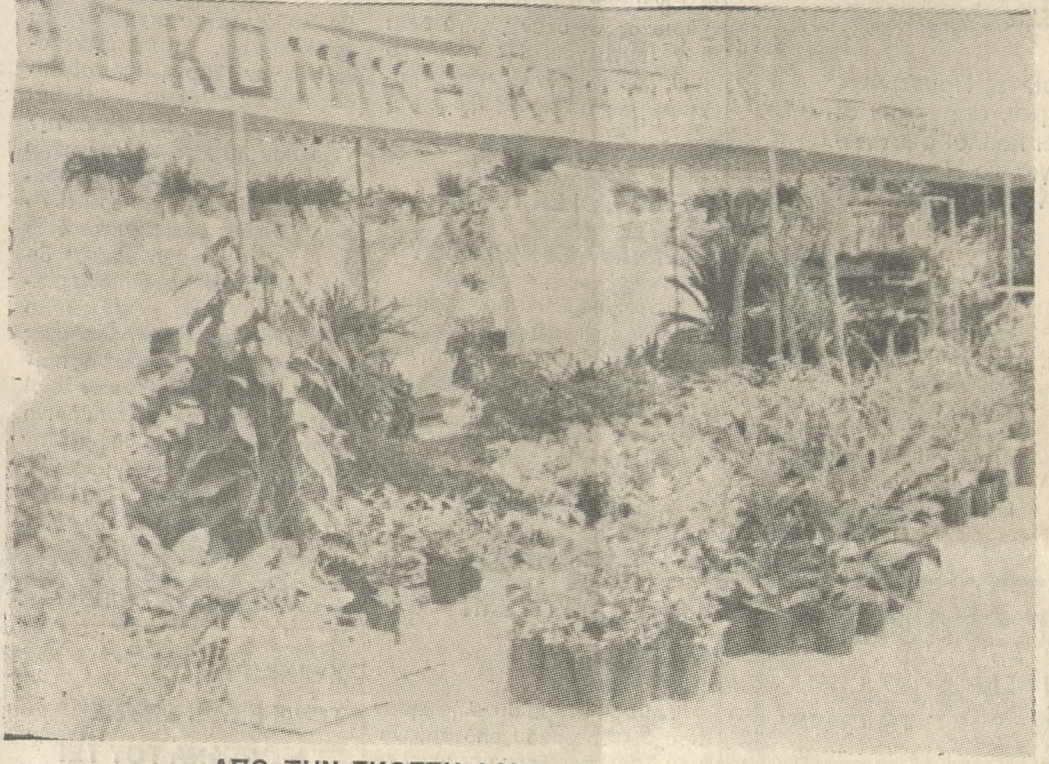
ΑΠΟ ΤΗΝ ΕΚΘΕΣΗ ΛΟΥΛΟΥΔΙΩΝ ΤΟΥ ΔΗΜΟΥ ΣΤΟ ΠΑΡΚΟ ΓΕΩΡΓΙΑΔΗ

ΤΕΤΑΡΤΗ 4 ΙΟΥΝΙΟΥ 1986 ΓΡΑΦΕΙΑ: Θεσσαλονίκης 2 Τ.Θ. 1160 ΤΥΠΟΓΡΑΦΕΙΑ: Λάμα 7, Μαστοράκης Διευθυντικός 232-599 Συντάξιας 234-058 Διαχειριστικής 282-825 Τυπογραφείου 234-058 ΤΗΛ. ΗΡΑΚΛΕΙΟΝ - ΚΡΗΤΗΣ