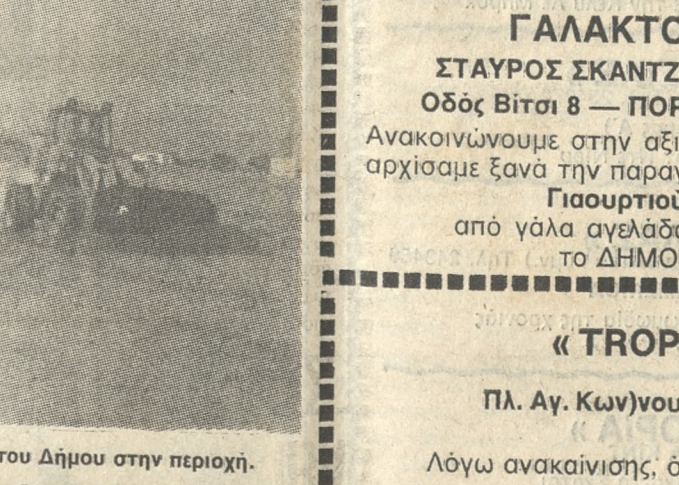
Από την τελευταία αμμοληψία του Δήμου στην περιοχή.

αν συνεχιστεί, θα οδηγήσει στην τέλεση διάβρωσης της παρταλίας και στη δημιουργία επεισοδίων με τους κατοίκους της περιοχής, καλούμε την επιτροπή αμμοληψίας να ανακαλέσει την άδεια πριν είναι πολύ αργά και απευθυνόμεστε σε όλους τους αρμόδιους βουλευτικούς και υπουργικούς επιπέδου, να εξετάσουν τον Α.Ν. 1219/38 που αντικείμενα ουσιαστικά στην προστασία του περιβάλλοντος.