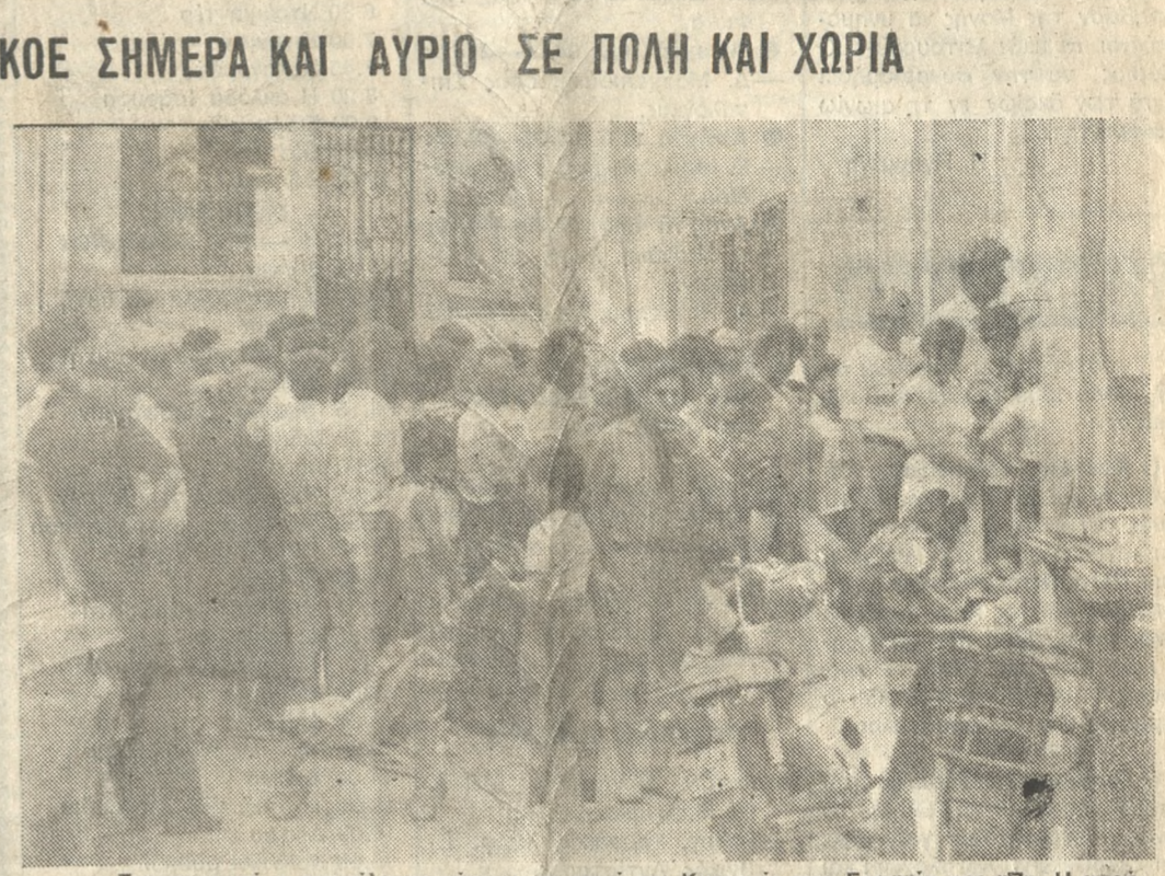
Εντυπωσιακή η προσέλευση κόσμου το πρωί της Κυριακής στα Γραφεία της «Π.Π». Η απρόβλεπτη κούραση σχηματίστηκε από ενθους το πρωί και φυσικά δεν στάθηκε δυνατόν να μετρηθούν όλοι.

Κινητό συνεργείο του Π.Α.Κ.Ο.Ε. με ειδικούς επιστήμονες θα πραγματοποιήσει σήμερα και αύριο νέες μετρήσεις σε ανθρώπους, τρόφιμα και ζώα στην πόλη και χωριά του Νομού. Στην πόλη το συνεργείο θα εγκατασταθεί σε κεντρική πλατεία (πλατεία Ελευθερίας) και θα μετρήσει άτομα μέχρι το μεσημέρι, ενώ το απόγευμα και αύριο θα επισκεφθεί τα χωριά Γωνιές, Ανώγειο, Ζωνίνα, Ρουκάνι, Καρκαδιώτισσα, Προφήτη Ηλία και Άγιο Σύλλα, όπου θα πραγματοποιήσει μετρήσεις σε ζώα και τρόφιμα. Τις επόμενες μέρες, επίσης, θα πραγματοποιήσει μετρήσεις παίρνοντας δείγματα θαλασσινού νερού προκειμένου να διαπιστωθεί ρύπανση ή μόλυνση.