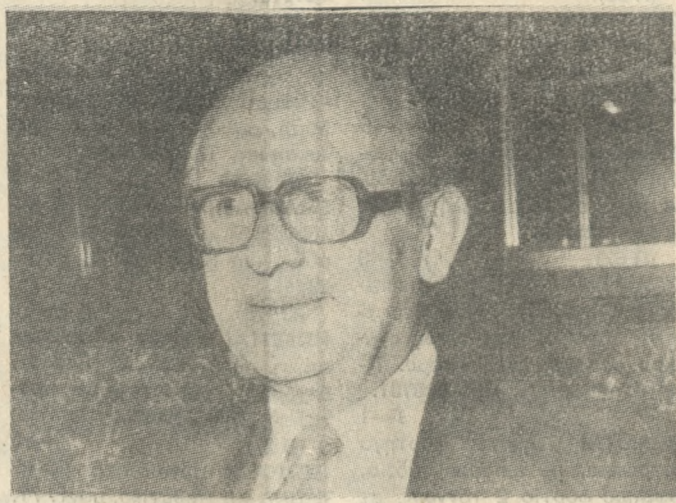
Ο Διοικητής της Τράπεζας της Ελλάδος κ. Χαλικιάς.

Πραγματοποιήθηκε η Ετήσια Γενική Συνέλευση των μετόχων της Τράπεζας της Ελλάδος.