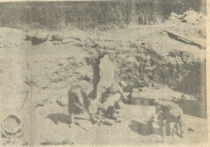
Από τις ανασκαφές που πραγματοποίησε η Βρετανική Αρχαιολογική Σχολή στην Κνωσό. Η φωτογραφία χρονολογείται από το 1900.