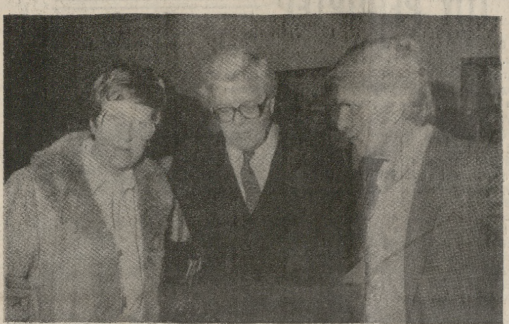
Ο κ. κ. και η Κα Χάου, χτες το μεσημέρι, ενώ ξεναγούνται στο Μουσείο Ηρακλείου, από τον κ. Σακελλαράκη.