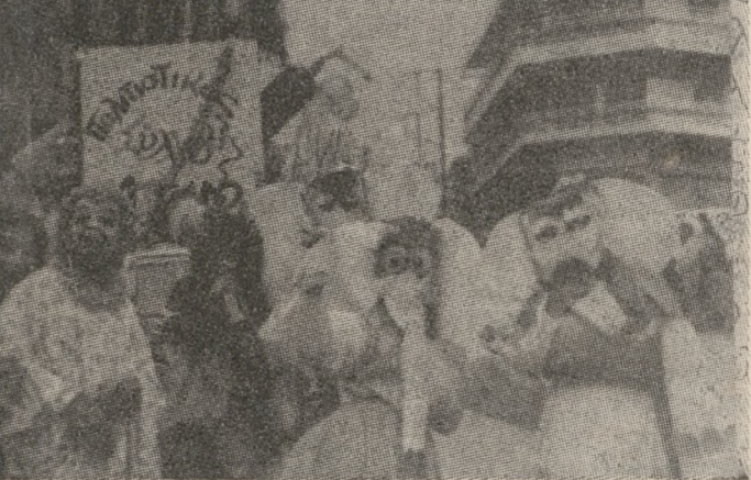
Τον μοναδικό που οργανώθηκε φέτος μέσα στην πόλη και σημειώσε τεράστια επιτυχία, αφού δεν περιορίστηκε μόνο στα όρια της συνοικίας, αλλά η πομπή του έφθασε μέχρι και το κέντρο του Ηρακλείου.

ΚΑΠΩΣ καθυστερημένα, η στήλη φιλοξενεί το κλισέ μιας φωτογραφίας από τον καρναβάλι που διοργάνωσε την περασμένη Κυριακή ο Πολιτιστικός Σύλλογος των Πατελλών. Το καρναβάλι ή-