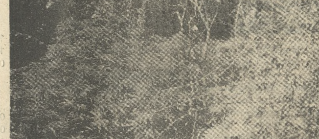
Η φυτεία με το χασίς της σπείρας. Πρόκειται για μια από τις μεγαλύτερες που βρέθηκαν ποτέ στην Κρήτη.

Με βάση τα στοιχεία αυτά μετά την άφιξη στο Ηράκλειο