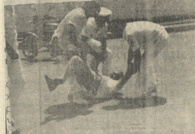
Στιγμιότυπο από τα επεισόδια της Παρασκευής.

Οι απεργιοί, λίγο πριν τη σύλληψή τους είχαν συγκεντρωθεί με άλλους του Λιμεναρχείου, οι οποίοι προστάθηκαν να πουν