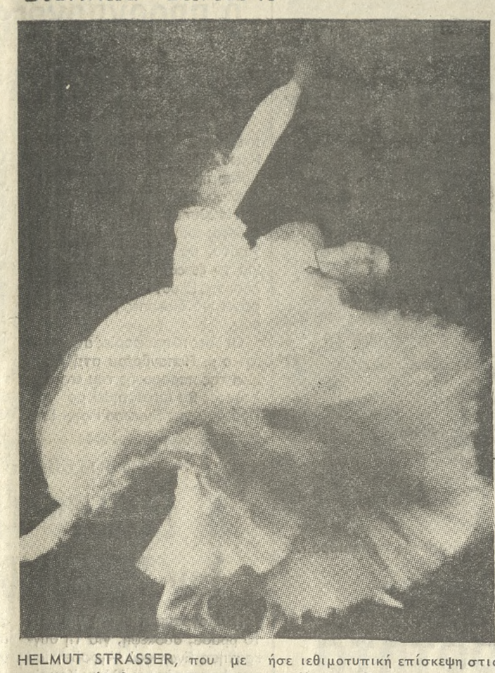
HELMUT STRASSER, που με ήσε ιερισμωτική επίσκεψη στις την ευκαιρία θα πραγματοποιη- Αρχές της πόλης.

ΕΙΚΟΝΟΜΕΤΡΩΜΕΝΟ Ηράκλειο — Καλοκαίρι '86 ΤΑ ΠΕΡΙΦΗΜΑ ΜΠΑΛΕΤΑ ΤΗΣ ΚΡΑΤΙΚΗΣ ΟΠΕΡΑΣ ΤΗΣ ΒΙΕΝΝΗΣ ΣΗΜΕΡΑ