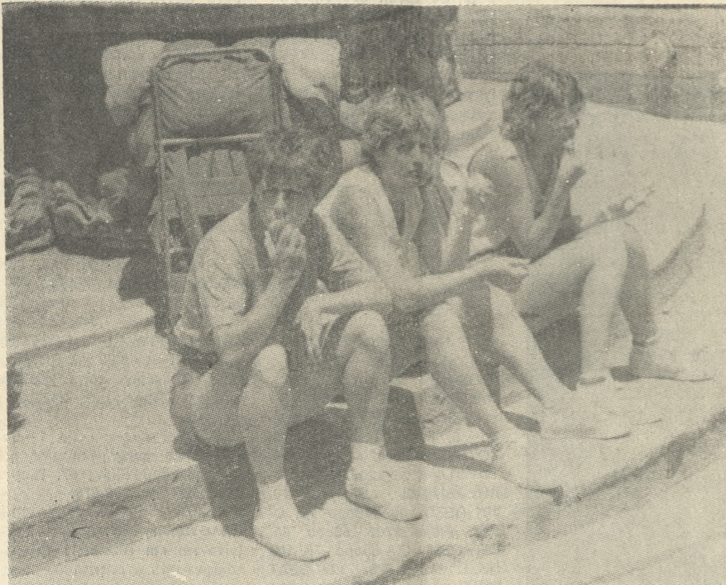
Για εφέτος κερδίσαμε τους λιποτάξιτους ξένους που προτιμούν για τόπο διαμονής το ύπαιθρο...