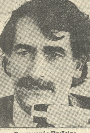
Ο υπουργός Παιδείας κ. Αντώνης Τρίπης

Ο κ. Πρύτανης αναμένεται να θέσει το θέμα στη βάση όχι μόνο της αντιμετώπισης του για τη φετινή χρονιά, αλλά της οριστικής λύσης του.