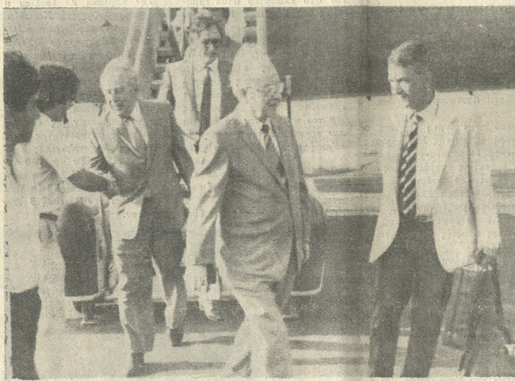
Ο Σοβιετικός απεσταλμένος Κωνσταντίνος Κορνιένκο, ανάμεσα στους Χρήστο Μαχαίριτα και Βίκτωρ Στουκάλην, κατά την άφιξη του στο αεροδρόμιο Ηρακλείου.

ΠΡΟΣΩΠΙΚΟ μήνυμα στον Πρωθυπουργό κ. Παπανδρέου, που για λίγες μέρες βρίσκεται για ανάπαυση στην Ελούντα, έφερε το απόγευμα, χθες, ο Κωνσταντίνος Κορνιένκο (πρώτος Γενικός Γραμματέας των Εξωτερικών Σχέσεων της ΕΣΣΔ) από τον Γ. Γραμματέα του Κ. Κ. της Σοβ. Ένωσης Μιχ. Κορμπατώφ. Ο Κορνιένκο έφθασε χθες το απόγευμα στην Αθήνα, και αμέσως αναχώρησε για το Ηράκλειο με την πτήση 510, για να φύγει στην συνέχεια στην Ελούντα με το αυτοκίνητο του κ. Παπανδρέου που τον περίμενε στο Αεροδρόμιο. Τον κ. Κορνιένκο συνόδευε στην Ελούντα, ο Πρεσβευτής της Σοβ. Ένωσης στην Ελλάδα κ. Στουκάλην, και ο Διευθυντής του Διπλωματικού Γραφείου του κ. Πρωθυπουργού Μαχαίριτας.