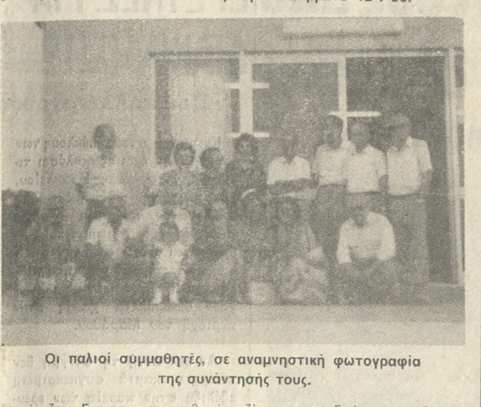
Οι παλιοί συμμαθητές, σε αναμνηστική φωτογραφία της συνάντησής τους.