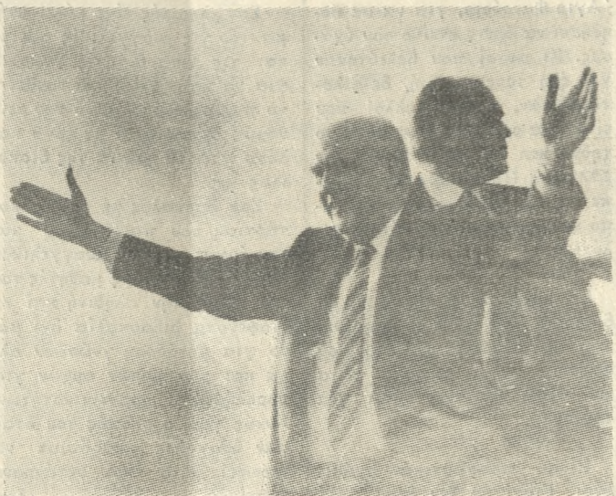
Ο Πρωθυπουργός, χθες, κατά την αναχώρησή του από το αεροδρόμιο Ηρακλείου.

Πρώτο θέμα που σήμερα απασχολεί την κυβέρνηση είναι το πρόβλημα της ανεργίας σε συνδυασμό πάντα με την σταθεροποίηση της οικονομίας. Την αναφορά και επισήμανση αυτή έκανε χθες στην πόλη μας, λίγο πριν την αναχώρησή του για την Αθήνα, ο Πρωθυπουργός κ. Α. Παπανδρέου απαντώντας σε ερωτήσεις δημοσιογράφων. Στην επισήμανση του αυτή ο κ. Παπανδρέου πρόθεσε ότι οι ρυθμοί απορρόφησης των ανέργων θα αλλάζουν τα επόμενα δύο χρόνια με την προϋπόθεση ότι θα υπάρχουν Νομαρχιακά αναπτυξιακά προγράμματα και φαντασία στην χάραξη των αποφάσεων.