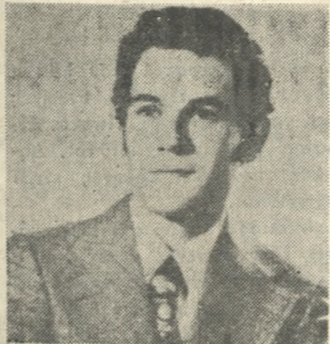
ΜΕ ΕΜΦΡΑΓΜΑ ΣΤΟ ΝΟΣΟΚΟΜΕΙΟ Ο ΒΟΥΛΕΥΤΗΣ κ. ΜΙΧ. ΓΑΛΕΝΙΑΝΟΣ

Ξαφνικό καρδιακό επεισόδιο έπαθε χθες το μεσημέρι ενώ βρισκόταν στη Βουλή ο βουλευτής Ηρακλείου της Ν.Δ. κ. Μιχάλης Γαλενιανός. Δ. κ. Γαλενιανός μεταφέρθηκε αμέσως στον «Ευαγγελισμό». Σύμφωνα με πληροφορίες από το οικογενειακό περιβάλλον του βουλευτή, αργά το βράδυ παρουσιάστηκε αισθητή βελτίωση και κατά την άφιξη των γιατρών του νοσοκομείου δεν διατρέχει κανένα κίνδυνο.