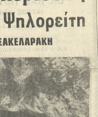
Το σπήλαιο του Ιδαίου Άντρου σε υψόμετρο 1500 μ. στον Ψηλορείτη.

Η ανασκαφική δραστηριότητα στο σπήλαιο του Ιδαίου Άντρου άρχισε όπως είναι γνωστό πριν λίγα χρόνια, εκατό χρόνια μετά την πρώτη ανασκαφή που έγινε το 1885.