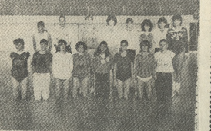
Η Εθνική ομάδα Βόλεϊ Νεανίδων, που προετοιμάζεται αυτές τις ημέρες στην πόλη με εν όψει των υποχρεώσεων που έχει στους τελικούς αγώνες του Πανευρωπαϊκού Πρωταθλήματος, που θα γίνουν στη Σοφία 17-24 Αυγούστου.