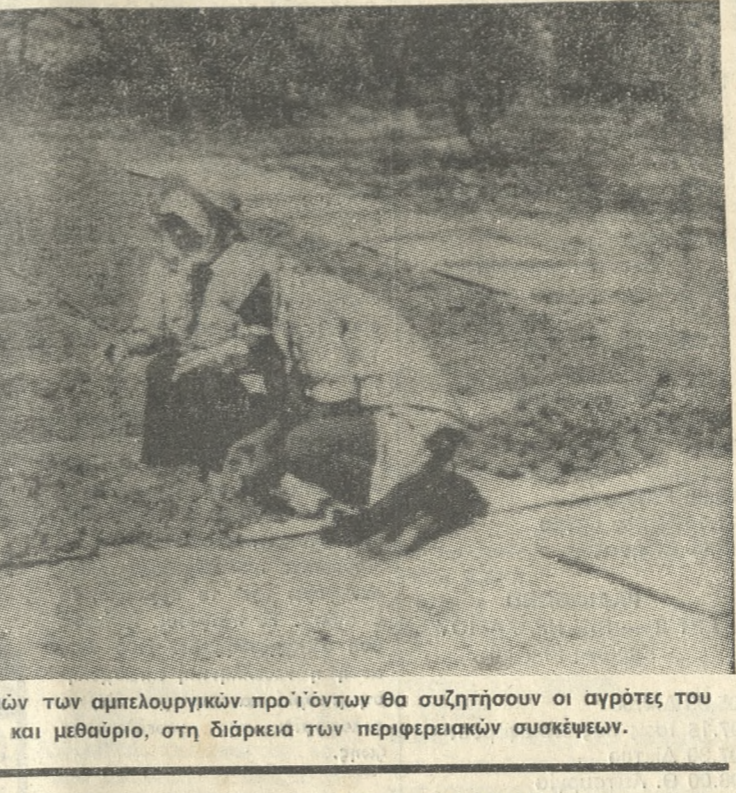
Για το θέμα των τιμών των άμπελουργικών προϊόντων θα συζητήσουν οι αγρότες του Νομού αύριο και μεθαύριο, στη διάρκεια των περιφερειακών συσκέψεων.

ΤΕΣΣΕΡΙΣ περιφερειακές συσκέψεις Αγροτικών Συλλόγων με αντικείμενο τις επαφές που έγιναν με το Υπουργείο Γεωργίας για τον καθορισμό της τιμής των άμπελουργικών προϊόντων, πρόκειται να πραγματοποιηθούν αύριο Δευτέρα και την Τρίτη, μετά από απόφαση του Διοικ. Συμβουλίου της Ομοσπονδίας Αγροτικών Συλλόγων Ν. Ηρακλείου. Οι συσκέψεις είναι οι παρακάτω: Αύριο Δευτέρα, στις 8 το βράδυ στο Χουδέτιο, όπου θα παρευθύνονται οι Αγροτικοί Σύλλογοι Αρχαίων, Καταλαφάριου, Πεζών, Κουανάβων, Χαρακίου, Λιγούρτων, Σκαλιανίου, Χουδέτιου. Την ίδια μέρα και μία ώρα αργότερα θα πραγματοποιηθεί άλλη συσκέψη στον Αγ. Μυρώνη στην οποία θα παρευθύνονται οι Σύλλογοι Πάνω Ασιτών, Κάτω Ασιτών, Βουτών, Σταυρακίων, Αυγενικής, Αγίας Βαρβάρας, Κερσίων, Δαφνών, Πενταμοδίου, Πετροκράβου, Πυργός και Αγίου Μυρώνη. Την Τρίτη, στις 9 το βράδυ, θα συγκεντρωθούν στον Προφ. Ηλία, οι Σύλλογοι Αγ. Σύλλα, Ρουκονίου, Βασιλείων, Δήμου Ηρακλείου, και Προφ. Ηλία. Την ίδια ώρα στον Κρουσώνα θα πραγματοποιηθεί άλλη συσκέψη στην οποία θα παρευθύνονται οι Σύλλογοι Γαζίου, Κορφών, Σάρχου, Φοδάε, Αχλάδων, Μαρθού Αστρακίων, Γωνιών και Κρουσώνα. Και στις 4 συσκέψεις θα προεδρεύουν τα μέλη του Δ.Σ. της ΟΑΣΗΝ τα οποία επισκέφθηκαν την εβδομάδα που μας πέρασε, το Υπουργείο.