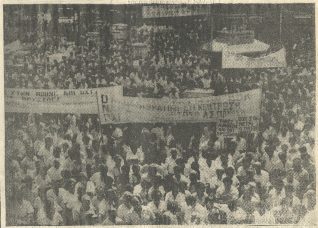
Στιγμιότυπο από το περυσινό συλλαλητήριο των αγροτών.

Η Α. Γ. ΠΕΤΖΕΤΑΚΙΣ Α.Ε. ανακοινώνει σχετικά με δημοσίευσμα των Δ. ΠΑΡΑΣΚΕΥΟΠΟΥΛΟΥ και EURODRIP Α.Β.Ε.Γ.Ε. 1. Χέσονται Δημοσίευσμα των Δ. Παρασκευοπούλου και EURODRIP Α.Β.Ε.Γ.Ε. παρείχε πληροφορία περί απαγορευόμενης παραγωγής και εμπορίας του σταλλακτικού σωλήνα HELIDROP που παράγει και διαθέτει η Α. Γ. ΠΕΤΖΕΤΑΚΙΣ Α.Ε. ύστερα από την, προσωρινής ισχύος, υπ' αριθμ. 13051/1986 απόφαση του Μονομελούς Πρωτοδικείου Αθηνών. 2. Η παραπάνω απόφαση, την μεθεπόμενη της εκδόσεώς της, ανεστάλη με την υπ' αριθμ. 443/86 διαταγή του Προέδρου Πρωτοδικών Αθηνών. 3. Η Α. Γ. ΠΕΤΖΕΤΑΚΙΣ Α.Ε. παράγει και διαθέτει τον σωλήνα HELIDROP, με παραχώρηση άδειας εκμετάλλευσής από την εταιρεία MAILLEFER S.A. και με καινούργια μηχανήματα κατασκευής της εταιρείας αυτής. 4. Επομένως, η παραγωγή από την Α. Γ. ΠΕΤΖΕΤΑΚΙΣ Α.Ε. του σωλήνα HELIDROP γίνεται σε ποιότητα που χαρακτηρίζει τα προϊόντα της και η πώλησή του είναι ελεύθερη. 5. Η Α. Γ. ΠΕΤΖΕΤΑΚΙΣ Α.Ε. επιφυλάσεται του δικαιώματός να ενεργήσει τα νόμιμα εναντίον εκείνων, που προσβάλλουν τα δικαιώματά της και για παραγωγή και για εμπορία του παραπάνω σωλήνα. Α. Γ. ΠΕΤΖΕΤΑΚΙΣ Α.Ε.