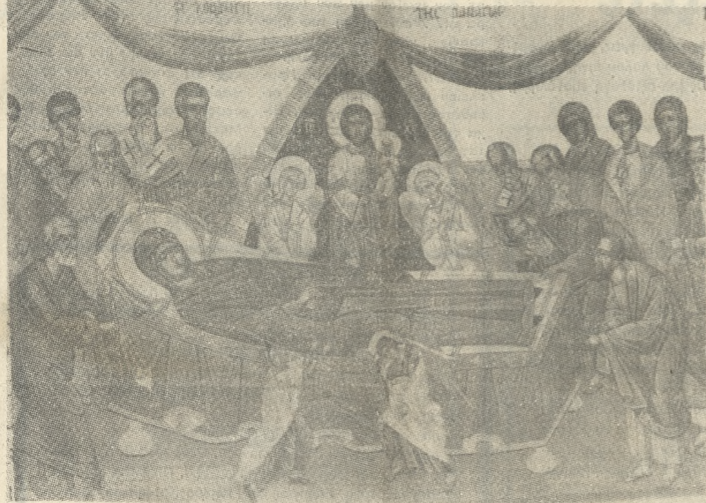
(Έργο του Αγιογράφου - Ιερέως: ΓΕΩΡΓΙΟΥ ΜΑΝΟΥΣΑΚΗ)