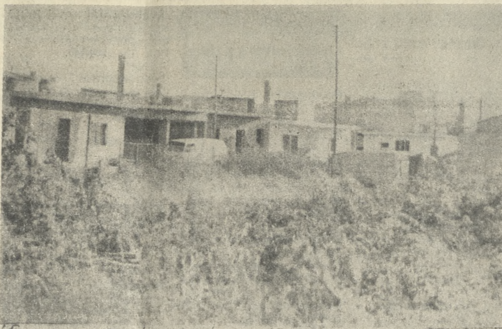
Ένα μέρος της περιοχής των «Τριών Βαγιών».

ΕΠΙΣΤΡΟΦΗ στο Ηράκλειο με τον Ντισελντορφ και άφιξη στις 5 το απόγευμα.