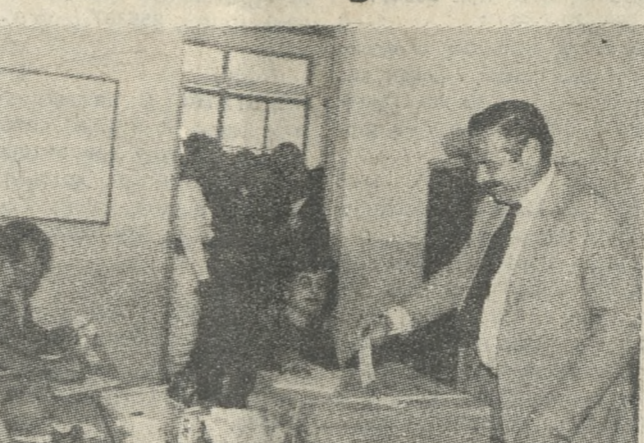
Κυριακής έχοντας εμπιστοσύνη στην ευδοκία του Ηρακλείου και όλα τα μέλη της «Δημοκρατικής Συνεργασίας» και στην ιστορία του μνημίου.