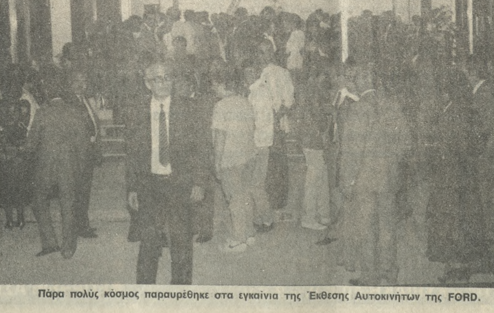
Πάρα πολύς κόσμος παραυρέθηκε στα εγκαίνια της Έκθεσης Αυτοκινήτων της FORD.