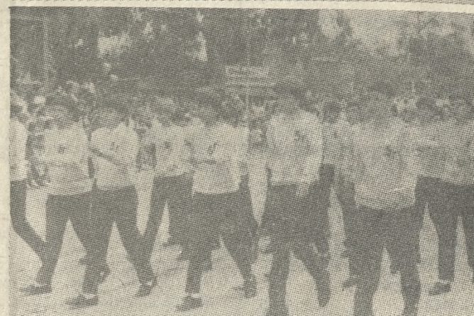
Στρατευμένη και μαθητικά νεολαία παρελθόντων προ των επισήμων, στην Πλατεία Ελευθερίας.