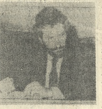
Ο παραίτηθείς Γεν. Δ'ντής της Δ.Ε.Η. κ. Δημ. Μαυράκης

Άμεση σχέση με την παραίτηση του Γεν. Δ'ντη της ΔΕΗ κ. Δημήτρη Μαυράκη έχει η «εν εξελίξει» ευρισκόμενη υπόθεση της εγκατάστασης των νέων Νηζελομηχανών στον Ατμοηλεκτρικό Σταθμό Λινοπεραμάτων. Αυτό δήλωσε χθες, στην «Π» ανώτατο στέλεχος της Δημοσίας Επιχείρησης Ηλεκτρισμού που είναι σε θέση να γνωρίζει «πρώτα να και πράματα» σε ειδικότητα που είχαμε μαζί του.