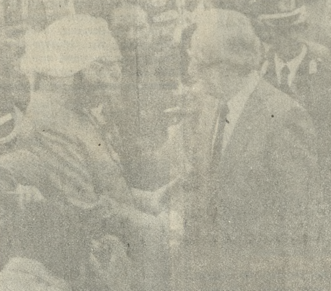
Ο Ινδός Πρόεδρος κ. Σιγκ, με τον Πρόεδρο της Δημοκρατίας κ. Σαρτζιτάκη, κατά την άφιξη του πρώτου στο αεροδρόμιο της Αθήνας.

Φθάει σήμερα στο Ηράκλειο, για ανεπίσημη 24ωρη επίσκεψη, ο Πρόεδρος της Δημοκρατίας της Ινδίας, κ. Τζαϊλ Σιγκ, ολοκληρώνοντας με αυτόν τον τρόπο την τετραήμερη επίσκεψη που πραγματοποιήσε στη χώρα μας, επικεφαλής αντιπροσωπείας της χώρας του.