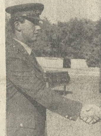
Η ΤΕΛΕΤΗ ΤΗΣ ΑΠΟΝΟΜΗΣ ΑΠΟΦΟΙΤΗΡΙΩΝ ΣΤΗ ΣΕΑΠ

Τα αποφοιτήρια των μαθητών της ΣΕΑΠ της 86 Γ' ΕΣΣΟ δόθηκαν χτες το πρωί στο Στρατιωτικό «Δασκαλογιάννη», από το Διοικητή της ΑΣΕΔΕ Αντιστράτηγο κ. Λάσκαρη. Παρόντες ήταν, ο Σεβ. Αρχιεπίσκοπος Κρήτης κ. Τιμόθεος, ο Νομάρχης Ηρακλείου κ. Λουκάκης, ο Διοικητής της ΣΕΑΠ Ταξίαρχος κ. Ζαζανιάκης, ο Διοικητής της 126 ΣΜ Σμήναρχος κ. Κορδώσης, ο Λιμενάρχης κ. Φουρτούνας, ο Διοικητής της Πυροσβεστικής κ. Αντωνόπουλος, ο Αερολιμενάρχης κ. Δούκας, ο Διοικητής της Αμερικανικής Βάσης κ.ά. Στα κίβη η εξέδρα των επισήμων (πάνω) και η απονομή αποφοιτηρίου σε μαθητή της Σχολής από τον Αντιστράτηγο κ. Λάσκαρη.