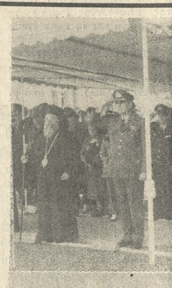
Η ΤΕΛΕΤΗ ΤΗΣ ΑΠΟΝΟΜΗΣ ΑΠΟΦΟΙΤΗΡΙΩΝ ΣΤΗ ΣΕΑΠ

Ετσι η μελέτη που θα παρουσαστεί στην σύσκεψη αλλά και τα ίδια τα συμπεράσματα που θα βγουν απ' αυτήν θα βοηθήσουν τη δουλειά του Οργανισμού.