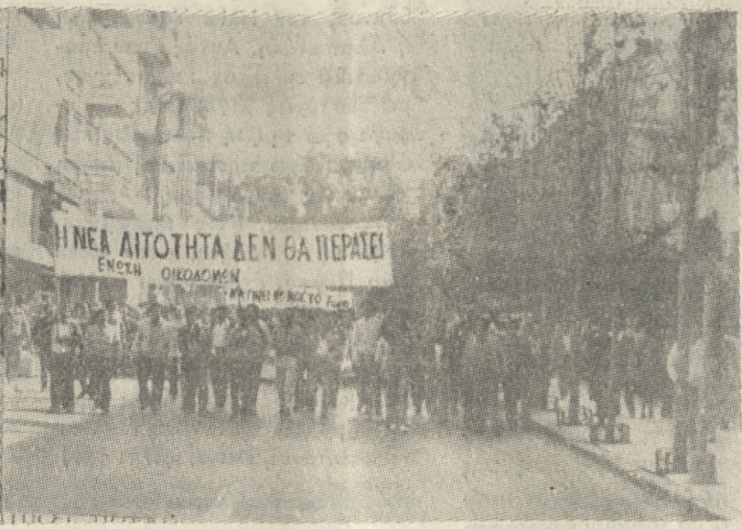
Στιγμιότυπο από πρόσφατη απεργιακή κινητοποίηση των εργαζομένων στο Ηράκλειο.

Λουκέτο στα σχολεία την Πέμπτη Πρόταση της Εκτελεστικής Επιτροπής της ΓΣΕΕ για απεργιακή κινητοποίηση των εργαζομένων στο δεύτερο 10ήμερο του Ιανουαρίου, τέθηκε χθες για έγκριση στην Ολομέλεια της Διοίκησης του Εργατικού Κέντρου Ηρακλείου, η οποία συνεδρίασε μέχρι αργά το βράδυ. Η πρόταση, η οποία αναμενόταν ότι θα γίνει αποδεκτή από τα μέλη της Διοίκησης, περιλαμβάνει την αιχμή των διεκδικήσεων της ΓΣΕΕ, την οποία αποτελούν η χορήγηση αυξήσεων πέραν της ΑΤΑ στους χαμηλόμισθους, η χορήγηση της ΑΤΑ στα καταβαλλόμενα, τα ενοίκια και τα Εποπτικά Συμβούλια.