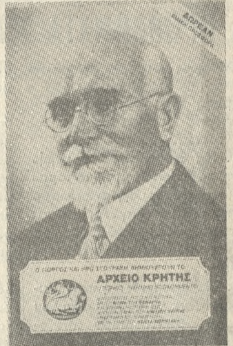
Το εξώφυλλο της κασέτας