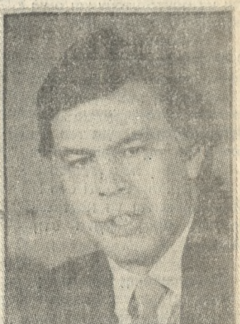
Ο Πρωθυπουργός της Ισπανίας κ. ΦΕΛΙΠΕ ΓΚΟΝΖΑΛΕΣ

(εκτιμήσεις των δυο ηγετών με τη συνάντηση κορυφής του Ρεϊκιάβικ). — ΕΟΚ: με έμφαση στην αγροτική πολιτική του λεγομένου Μεσογειακού μετώπου της Κοινότητας καθώς και τη σύγκλιση των οικονομικών των χωρών μελών. — Βαλκάνια - Λατινική Αμερική: ενθάρρυνση από τον κ. Παπανδρέου για όλα τα θέματα της περιοχής μας και ενθάρρυνση από τον κ. Γκονζάλες για τα θέματα της Λατινικής Αμερικής. — Κύπρος - Αιγαίο: ενημέρωση από τον κ. Παπανδρέου για τα εθνικά μας θέματα. — Τρομοκρατία.