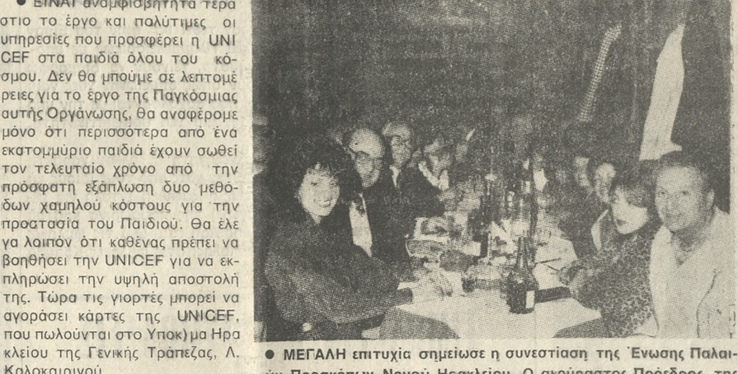
ΜΕΓΑΛΗ επιτυχία σημείωσε η συνέντευξη της Ένωσης Παιδών Προσκόπων Νομού Ηρακλείου...