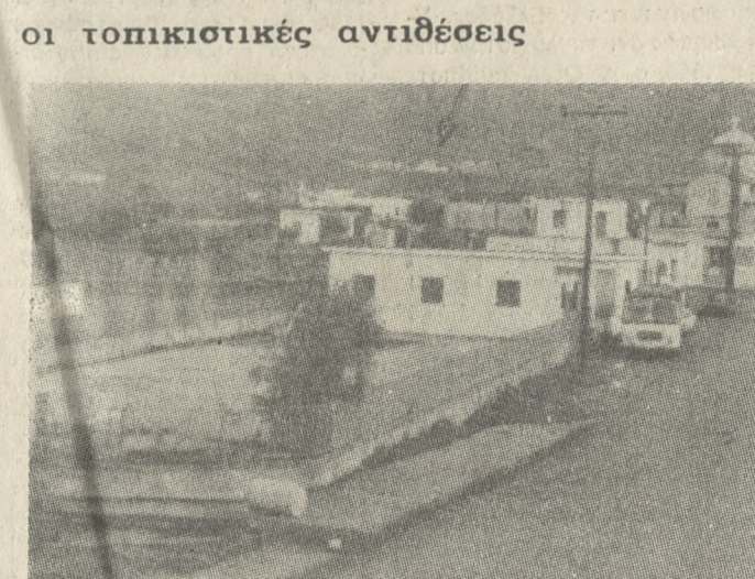
Το νέο κτίριο που εξοφλήθηκε για να καλυφθεί τις ανάγκες των μαθητών της περιοχής. Σ' αυτό δεν πάτησαν το πόδι τους οι μαθητές του Μηλιαράδω.

Μαθητές χωρίς σχολείο και μαθήματα! Για τρεις ολόκληρους μήνες αυτής της σχολικής χρονιάς, τα παιδιά του Δημοτικού, ενός χωριού, δεν παρακολουθούν μαθήματα αφού οι γονείς τους αρνούνται να στείλουν τους μικρούς μαθητές στο σχολείο! Το περιστατικό που θυμίζει... απίστευτη ιστοριούλα μια και κανείς δεν φαίνεται να αναλογίζεται τις συνέπειες, στιγματίζει ανεξήγητα το απερχόμενο 1986 και γιατί όχι θα πρέπει να δημιουργήσει σε πολλά ερωτηματικά κυρίως για την στάση της πολιτείας στην εφαρμογή των Νόμων.