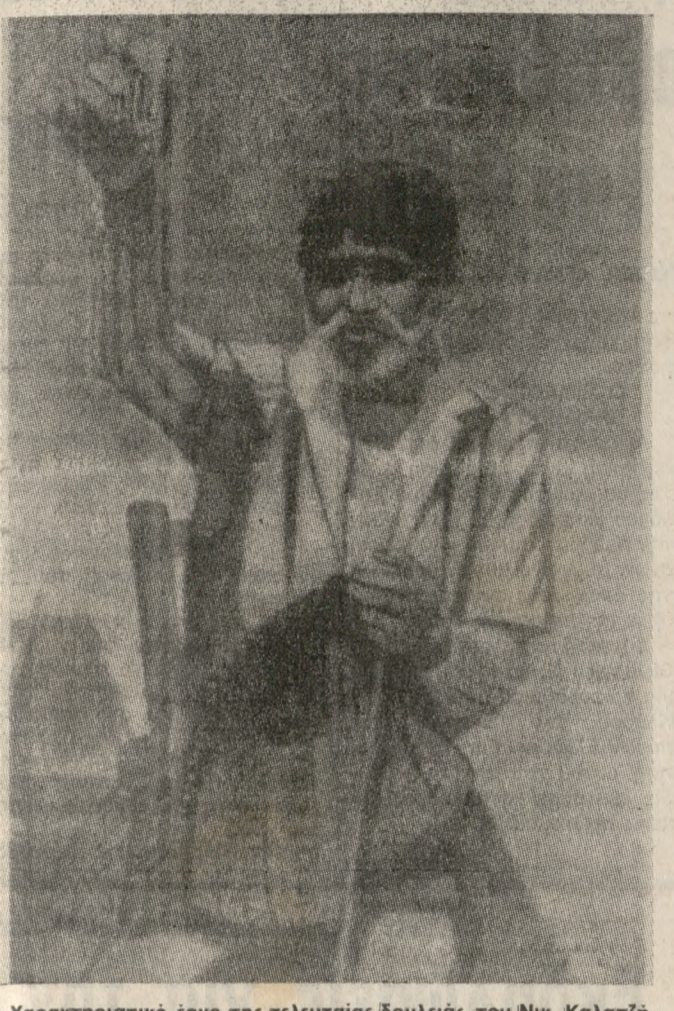
Χαρακτηριστικό έργο της τελευταίας δουλειάς του Νικ. Καλατζή.