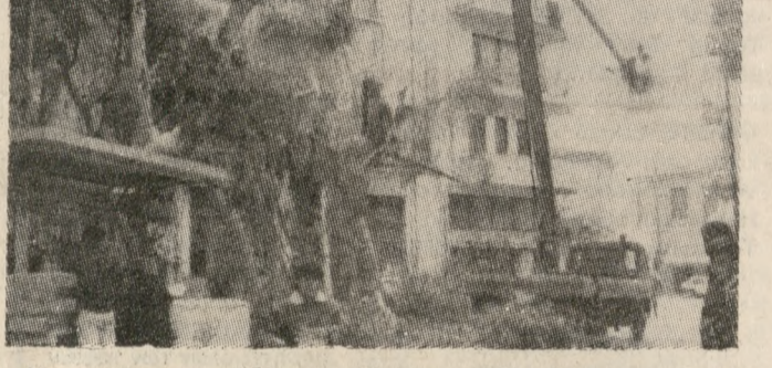
Δήμου. Έτσι και τα δέντρα κόνανσαν αλλά και η περιοχή από τα περσιτά «βάρη». (Φωτογραφία Ν. Μαλτεζάκης).