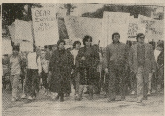
Γονείς, δάσκαλοι και μαθητές του 7ου Δημοτικού Σχολείου στη χθεσινή πορεία

Με μια μαχητική πορεία στους δρόμους της πόλης και συγκέντρωση έξω από τη Νομαρχία, οι μαθητές του 7ου Δημοτικού Σχολείου, μαζί με τους δασκάλους και τους γονείς τους, απάτησαν χτες να παρθούν μέτρα από τη Νομαρχία ώστε να μεταστειρευτούν άμεσα από το ετοιμόρροπο κτίριο στο οποίο αυτή τη στιγμή στεγάζονται (μαζί με το 16ο Νηπιαγωγείο και το 1ο Δημοτικό για ειδικά παιδιά).