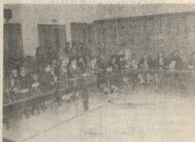
Στιγμιότυπο από τη χθεσινή σύσκεψη για το Πανεπιστήμιο, που έγινε στην αίθουσα «Θεοτοκόπουλος».

Εκκληση προς όλες τις πλευρές να γίνει δεκτό το οποιοδήποτε αποτέλεσμα των επερχόμενων επαναληπτικών πρυτανικών εκλογών, απηύθυναν χθες το μεσημέρι οι μαζικοί φορείς που συμμετείχαν στη σύσκεψη για τα προβλήματα του Πανεπιστημίου Κρήτης.