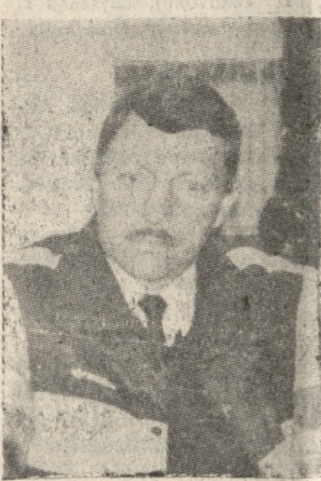
Ο άξιος προπονητής ο οποίος χαράζει και πάλι τον δρόμο του ΟΦΗ προς την Ευρώπη.